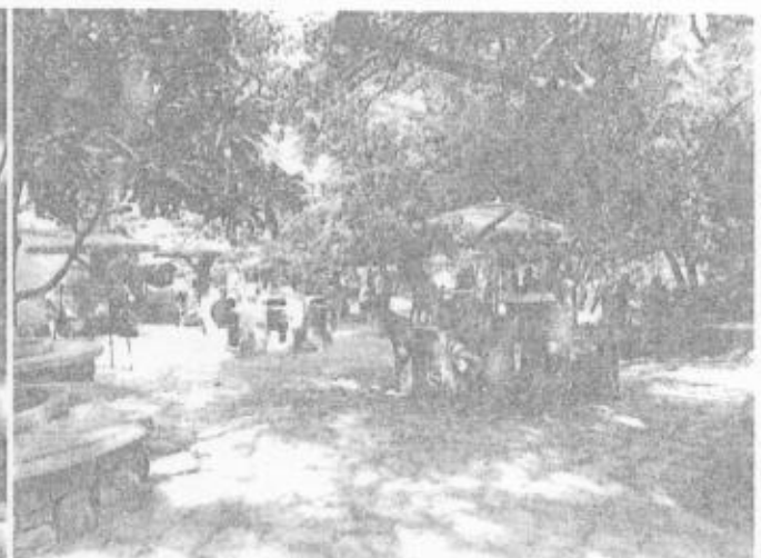
Visita de inspección a Pago – Pago Cascadas de Micos, Cd. Valles, S.L.P.