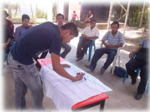
Ilustración 03. Identificación de las necesidades y temas de interés y explicación en lengua materna Tének dentro del grupo de hombres menores de 50 años.