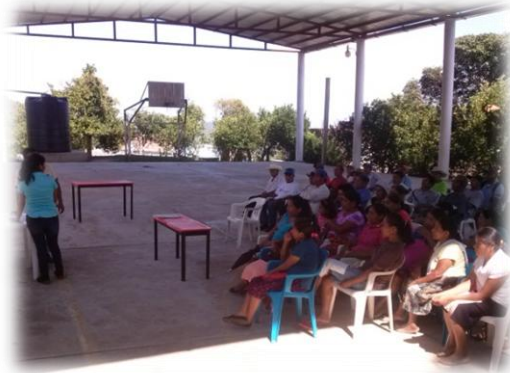
Ilustración 06. Análisis de la situación actual que guarda el derecho de acceso a la información pública.