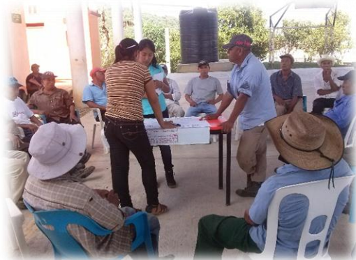
Ilustración 04. Identificación de las necesidades y temas de interés dentro del grupo de los adultos mayores de 50 años.