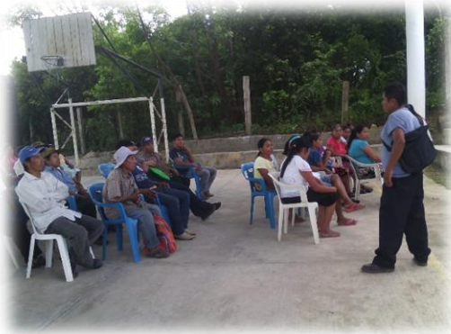
Ilustración 01. Delegado del Barrio de Cuayopiactla da la bienvenida al taller.