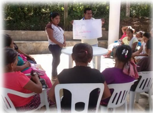
Ilustración 05. Identificación de la problemática central en el grupo de las mujeres.