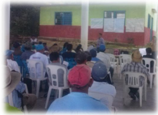
Ilustración 02. Encuadre del taller de evaluación diagnóstica.