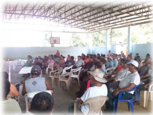
Ilustración 03. Participantes al taller de evaluación diagnóstica.