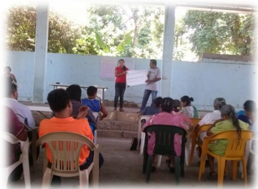
Ilustración 04. Análisis de la situación actual que guarda el derecho de acceso a la información pública.