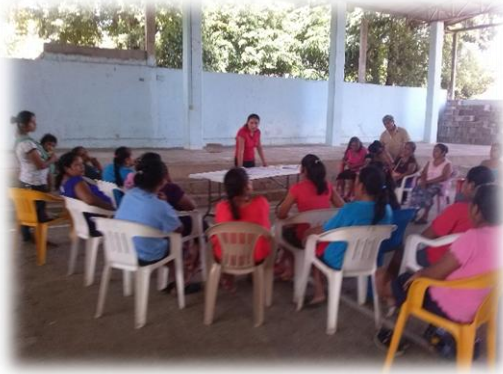
Ilustración 01. Explicación de las actividades a realizar durante el taller de evaluación diagnóstica.

La presente memoria fotográfica es realizado en base a los trabajos realizados por el personal del Sistema Acércate perteneciente al equipo de Tancanhuitz, dentro de las comunidades seleccionadas por el mimos proyecto.