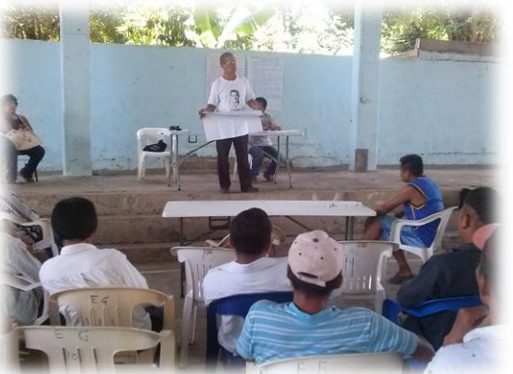
Ilustración 06. Exposición en plenaria de los resultados obtenidos en las mesas de trabajo por parte de las personas adultas.