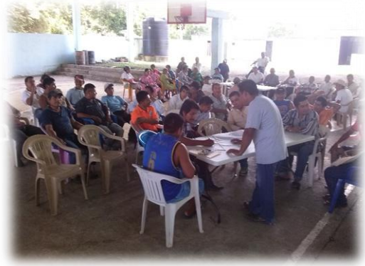
Ilustración 02. Identificación de las necesidades y temas de interés y explicación en lengua materna Tének dentro del grupo de hombres menores a 50 años.