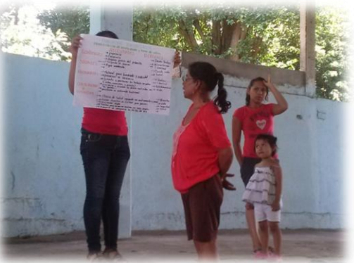
Ilustración 05. Exposición en plenaria de los resultados obtenidos en las mesas de trabajo por parte de las mujeres.