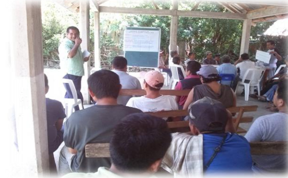
Ilustración 4. Grupo de adultos mayores en el ejercicio de la identificación de necesidades y problemática