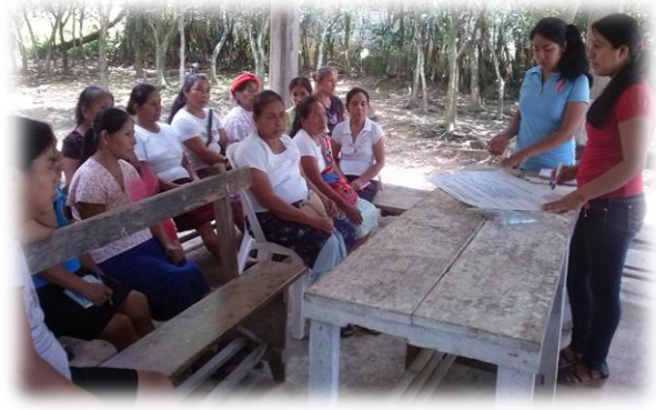
Ilustración 2. Grupo de mujeres en el ejercicio de la identificación de necesidades y problemática central.