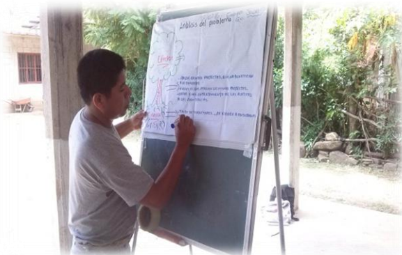
Ilustración 5. Ejercicio de la identificación de necesidades de manera participativa.