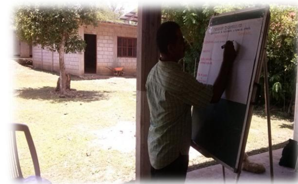
Ilustración 6. Ejercicio de la identificación de necesidades y arbolito de problemas de manera participativa.