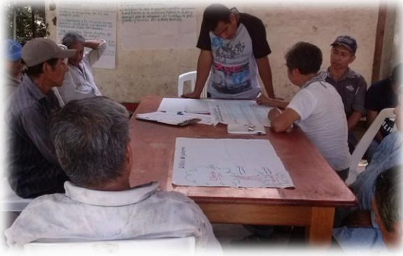
Ilustración 3. Grupo de hombres en el ejercicio de la identificación de necesidades y problemática central.