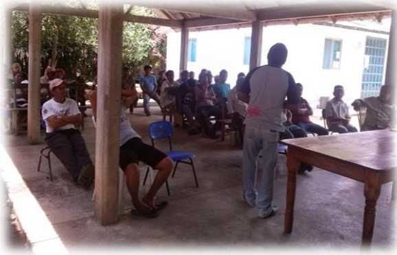
Ilustración 7. Agradecimiento a las personas reunidas al taller de evaluación diagnóstica.