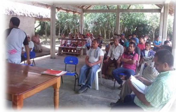
Ilustración 8. Generación de acuerdos y compromisos en el seguimiento al proyecto Sistema Acércate y sugerencia por parte de la autoridad comunitaria de construcción de una oficina en la región.