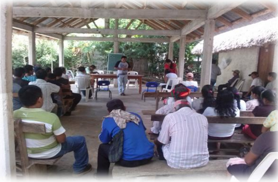
Ilustración 1. Presentación y Exposición de los temas, del Sistema acércate y lo que es la CEGAIP.