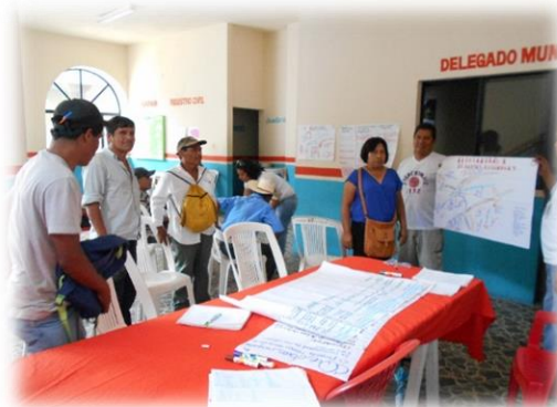
Pasan equipo de dos a explicar el ámbito Cultural.