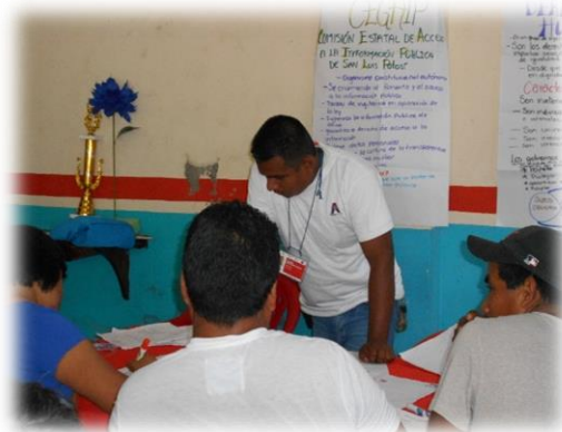
Participación en las mesas de trabajo.