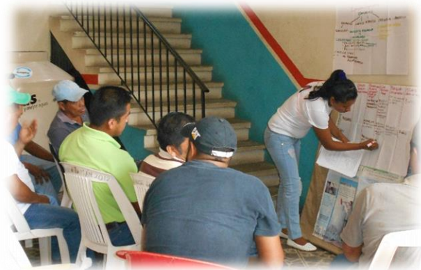
Participación en las mesas de trabajo.