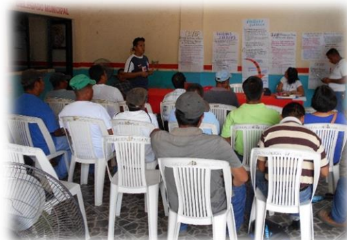
Dando la reunión informativa y sencibilización de los temas derechos humanos, políticas públicas, derecho al acceso de información, CEGAIP, Sistema acercate, acargo de los promotores.