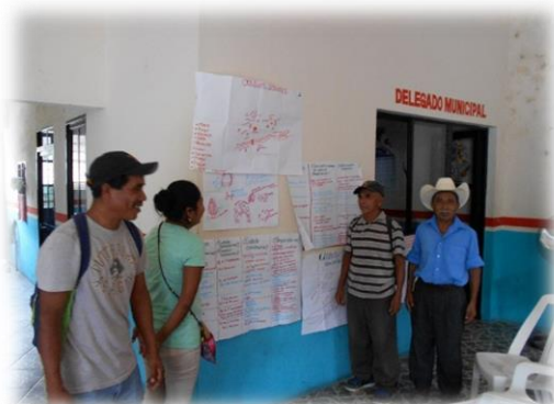
Pasan equipo de dos a explicar el ámbito económico.