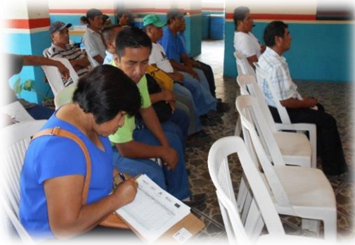
Se recaba los nombres de delegados y representantes de todos los barrios para darles la bienvenida y participación.