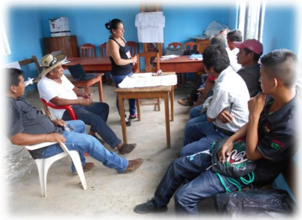
Ilustración 04. Ejercicio de análisis de la situación del acceso a la información y rendición de cuentas.