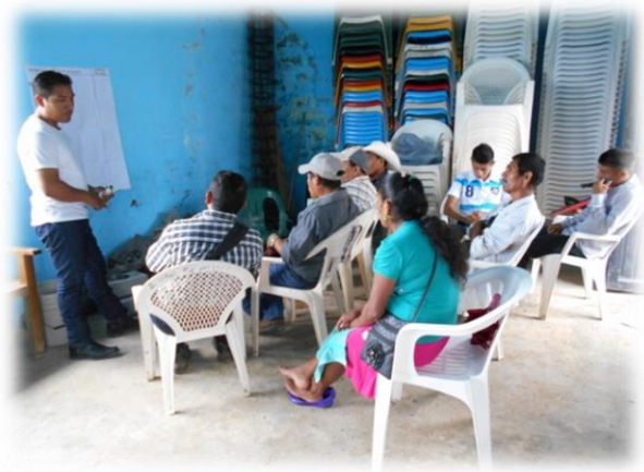
Ilustración 02. Grupo de trabajo donde expusieron sus necesidades y problemáticas.