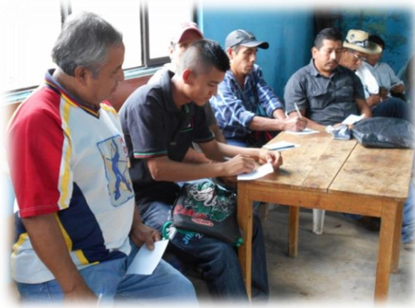
Ilustración 01. Participantes al taller de evaluación diagnóstica, en el encuadre del taller.