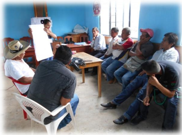
Ilustración 03. Grupo de trabajo con los hombres en donde expusieron sus necesidades y problemáticas.