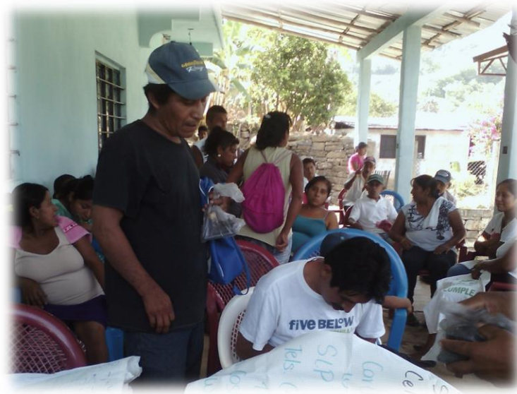
Ilustración 2. Se realizó el pase de lista, el cual las autoridades presentes apoyaron para ser ellos quien recaudara los datos.