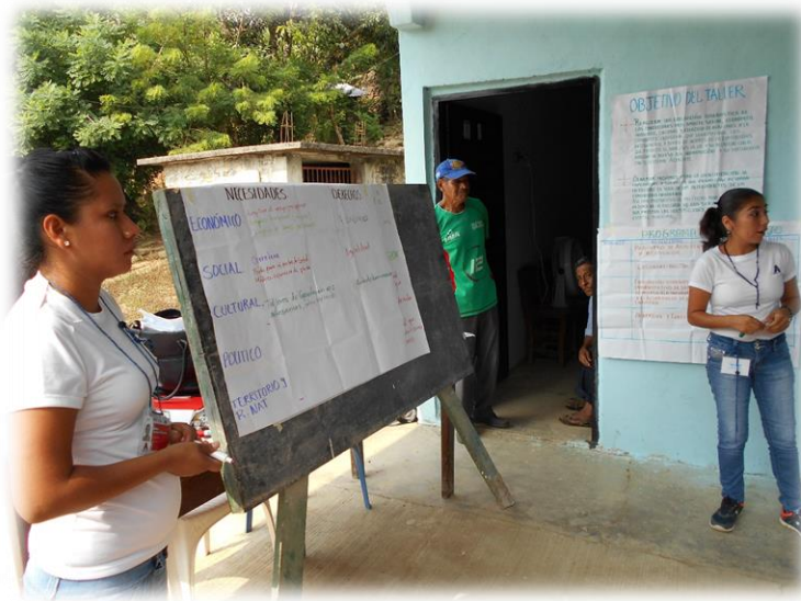
Ilustración 4. Se continuó con la participación de la gente para que nos dieran a conocer cuáles eran las necesidades en su comunidad.