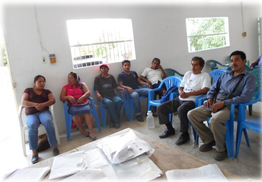
Ilustración 4. Anexando las opiniones de los participantes de la comunidad de Papatlas.