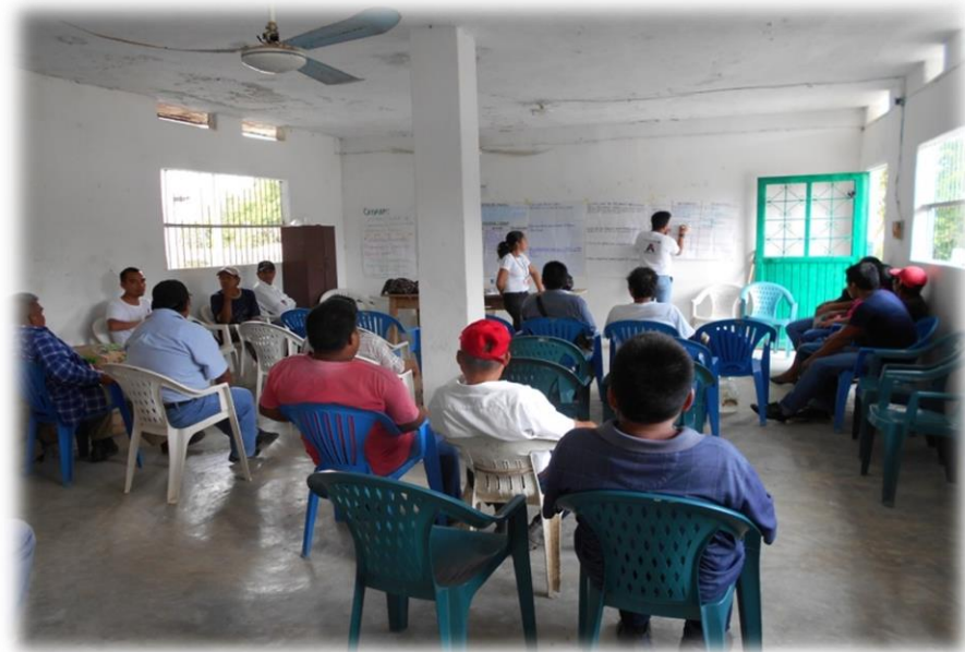
Ilustración 2. Participación de los asistentes de la comunidad de Papatlas