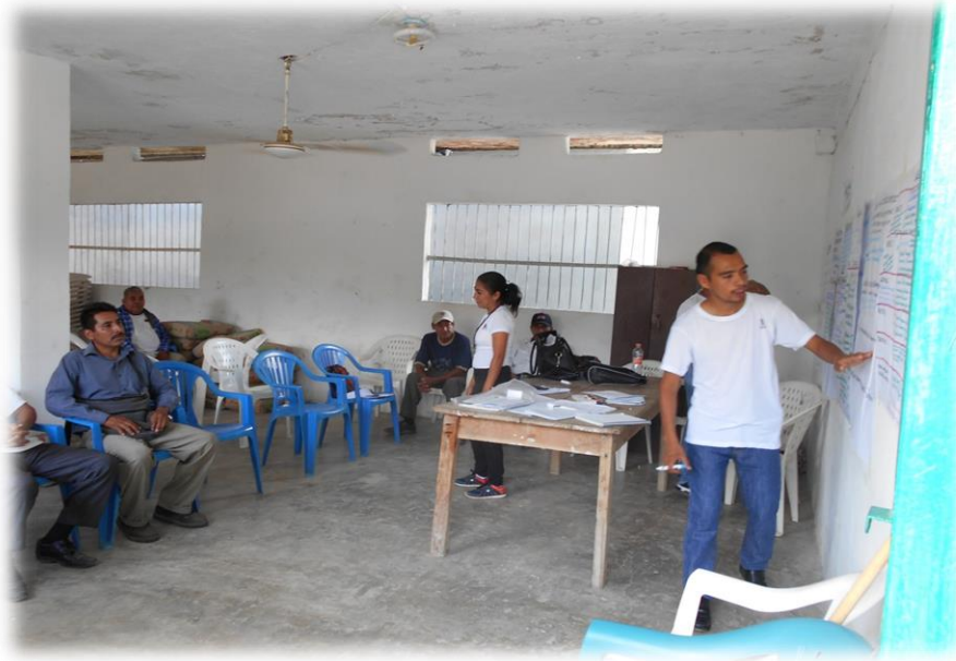
Ilustración 3. Explicando detalladamente sobre Sistema Acércate: Servicios y Programas para ti.