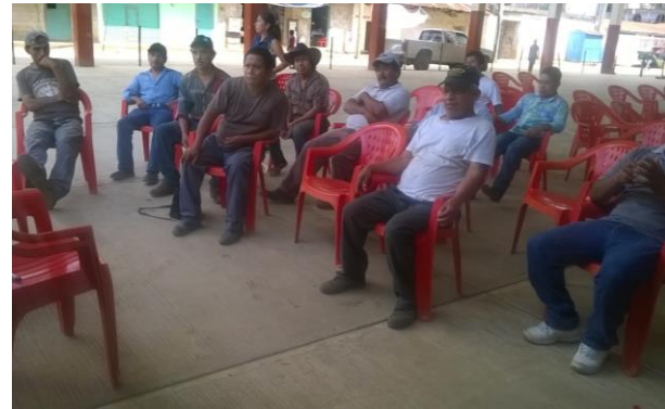
Ilustración 1 y 2. Encuadre del taller de evaluación diagnóstica.