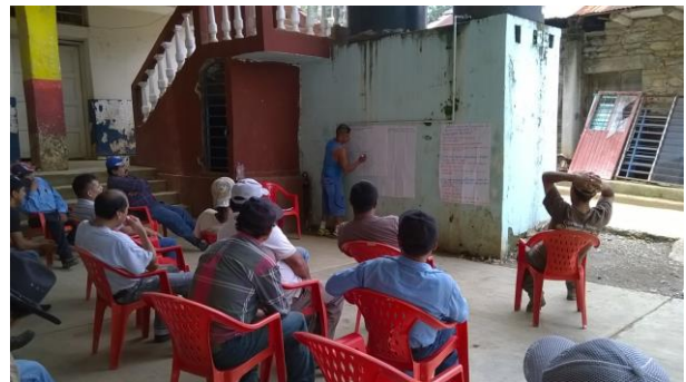
Ilustración 3 y 4. Mesas de trabajo para la identificación de necesidades y temas de interés.