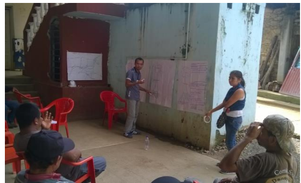
Ilustración 5 y 6. Mesas de trabajo para la identificación de necesidades y análisis de la problemática central.