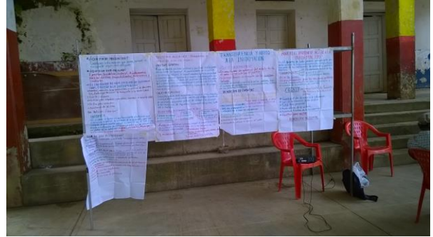
Ilustración 7 y 8. Diagnostico del acceso a la información y resultados obtenidos en el taller de evaluación diagnóstica.