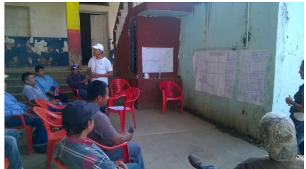
Ilustración 9 y 10. Explicación de los resultados obtenidos del taller en plenaria y generación de acuerdos y consensos para el seguimiento del sistema acércate.