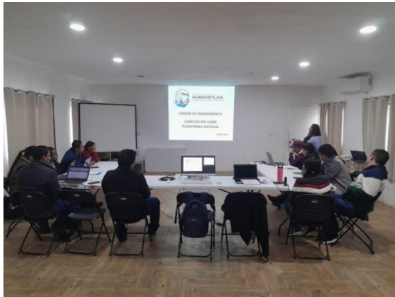
06 de enero de 2025, Capacitación sobre el uso de la Plataforma Nacional de Transparencia