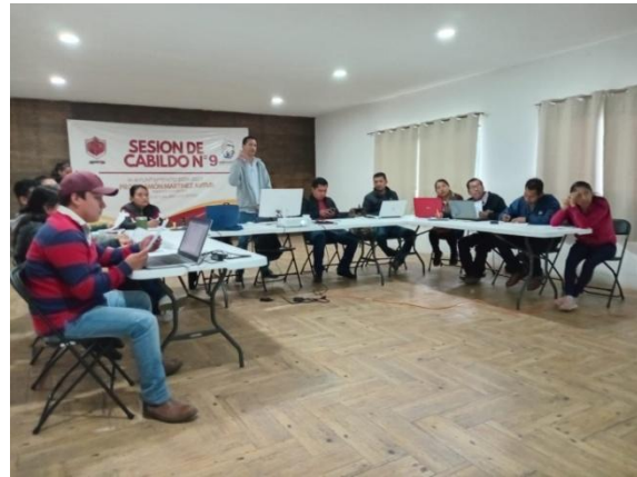
16 de enero de 2025, Taller de carga de formatos a la Plataforma Nacional de Transparencia