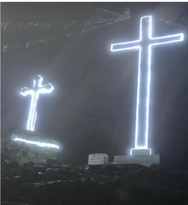
ILUMINACION DE LA CRUZ EN EL CERRO DE LA LOCALIDAD DE MAZATETL