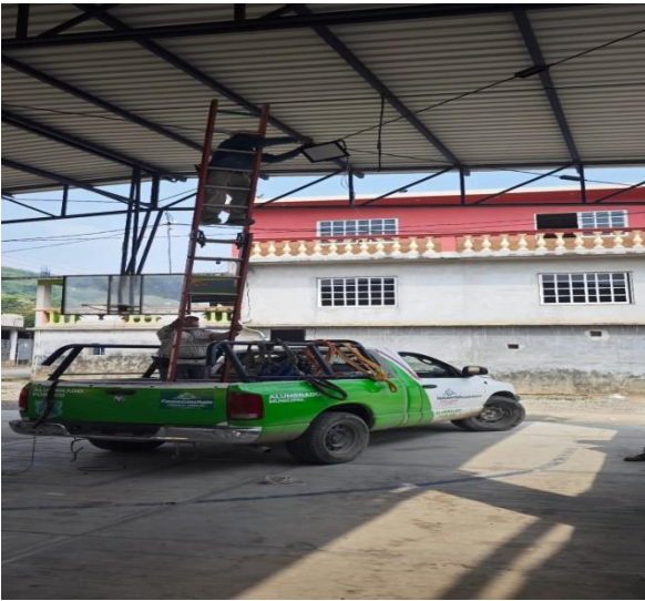
INSTALACION DE REFLECTORES LOCALIDAD DE TEMAMATLA