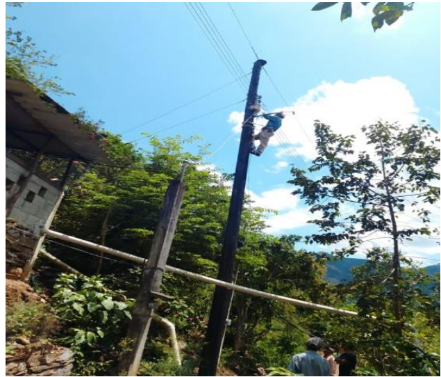
ARREGLO DE LUMINARIAS EN LOCALIDAD DE HUICHAPA