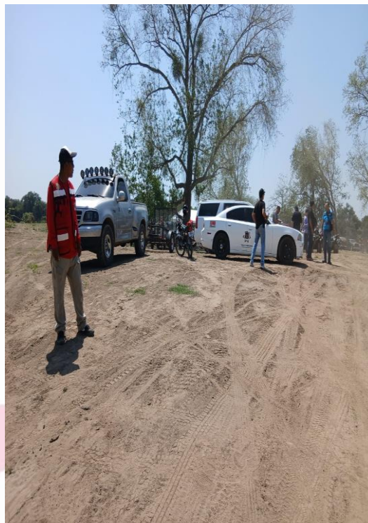
APOYANDO EN LA CABALGATA