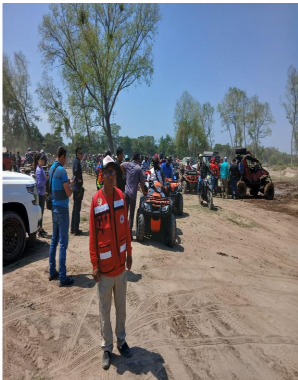
ACORDONAMIENTO EN CABALGATA.