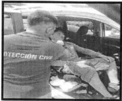
Se atendió reporte de un accidente automovilístico en el tramo de la Y griega, perteneciente al municipio de Axtla.