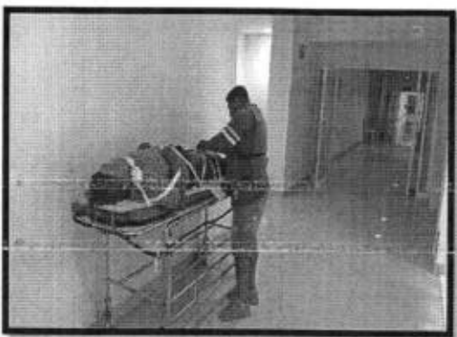
Se brindó apoyo de primeros auxilios y traslado a una persona que se accidentó en su motocicleta en la localidad de Chimalaco.

ESTA INFORMACION SE ENCUENTRA UBICADA: EN LA REPISA 1- A (ACCIONES REALIZADAS/ACCIONES PROGRAMADAS) *100 META ANUAL: 392 META ALCANZADA: 233