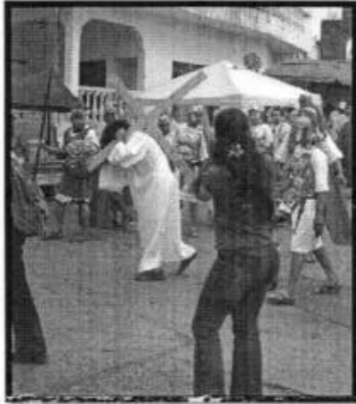
Se brindó apoyo durante el viacrucis durante la temporada de "Semana Santa 2026"