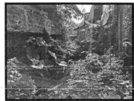
Se atendió reporte de un enjambre de avispas en la colonia La Libertad.