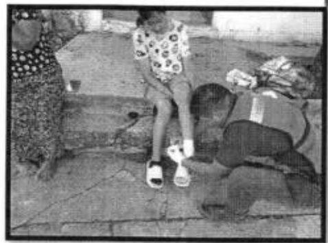
Se atendió reporte ante una mordida de un can a una menor en la colonia La Libertad.