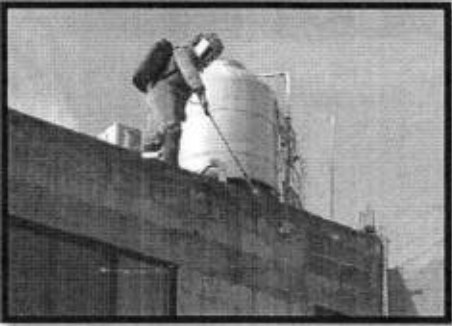
Se atendió reporte de un enjambre de abejas en el hotel Axtla.