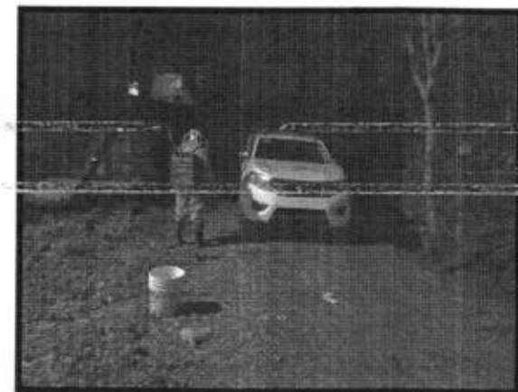
Se atendieron reportes de enjambres de abejas y de avispas en diversas localidades y parte de la cabecera del municipio de Axtla.