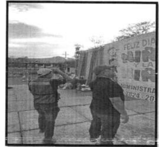
Se brindó apoyo en el evento masivo del "Día del Niño 2026".

ESTA INFORMACION SE ENCUENTRA UBICADA: EN LA REPISA 1- A (ACCIONES REALIZADAS/ACCIONES PROGRAMADAS) *100