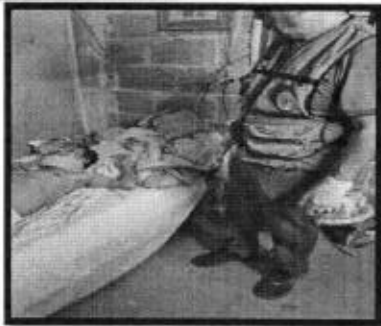
Se atendió reporte de una persona de la tercera edad que presentaba problemas de salud, por lo que fue trasladado al Hospital Imss rural.