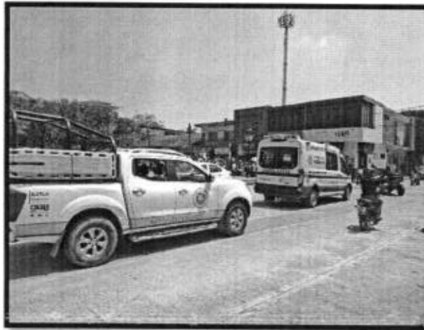
Se brindó apoyo durante el recorrido en la procesión religiosa "Cristo Vive".