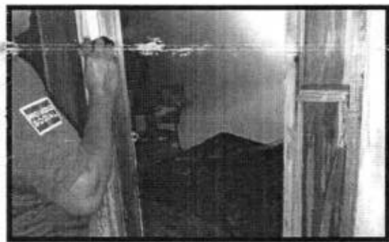
Se atendió reporte de un incendio en la colonia San Juan Bosco, perteneciente al municipio de Axtla.