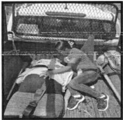
Se atendió reporte de una mujer embarazada quien sufrió caída de su propia altura, por lo que fue trasladada al Hospital Imss rural de Axtla.