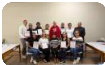
Ceremonia de Clausura