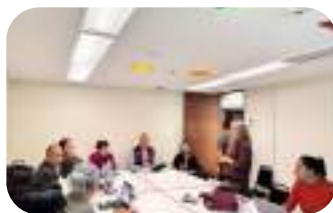
Ceremonia de Inauguración

X Reunión Nacional de Revisión por la Dirección del Sistema de Gestión Integral del Grupo 4 Multisitios convocada por el Tecnológico Nacional de México del 10 al 12 de diciembre de 2025