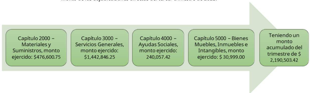
Monto de las adjudicaciones directas del tercer trimestre de 2025.

Se realizaron los pagos de los servicios básicos que a continuación se describen: