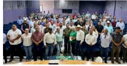
Municipios de la Zona Media y Huasteca.