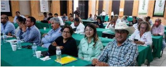
Municipios de la Zona Centro y Altiplano.