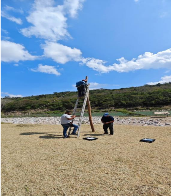
PARAJE TURISTICO "MECATLAN"