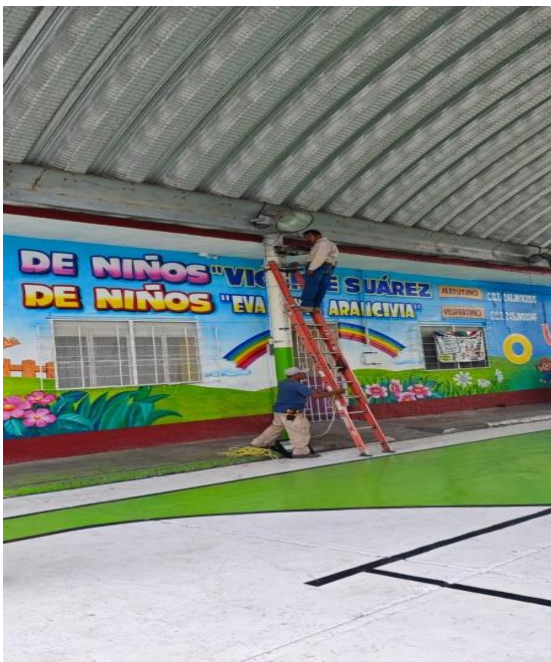
INSTALACION DE REFLECTORES EN LA CANCHA MUNICIPAL