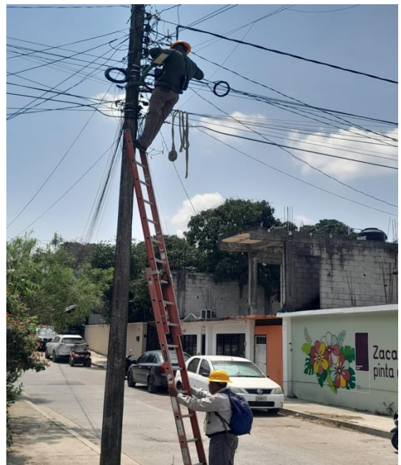
ARREGLO DE LUMINARIAS EN ZACATIPAN