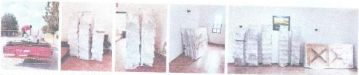
Productos de limpieza 13/04/2026

Se recibió el siguiente mobiliario adquirido por parte del SMDIF, 20 SILLA CROSSBACK TAPIZ FIJO CRUCETA DE METAL 11/04/26