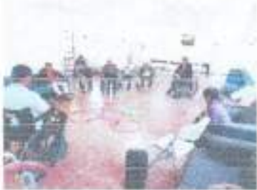
Actividades de psicología