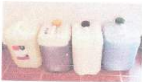
Material de limpieza 14/04/26