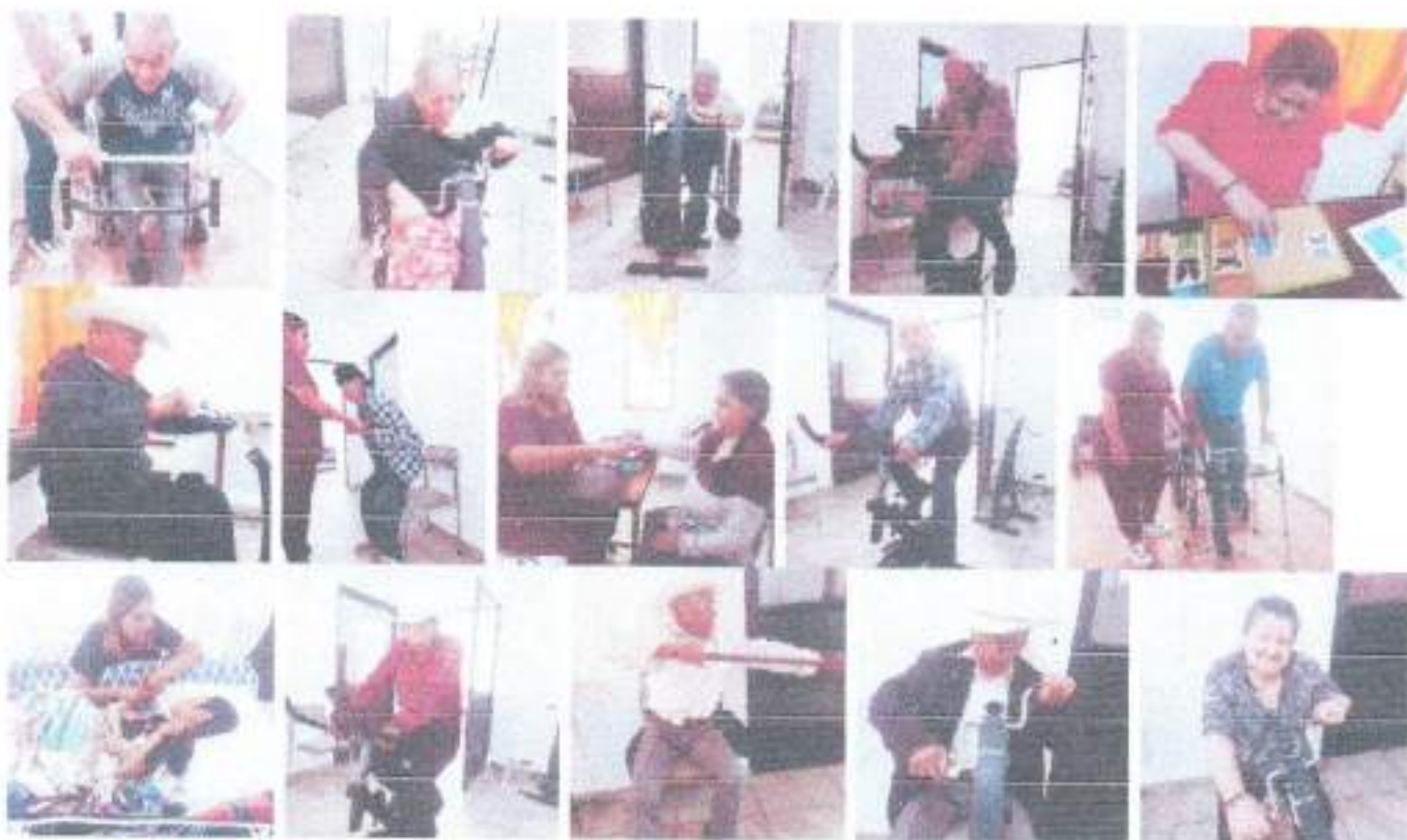
Actividades de terapia ocupacional

ASILO DE ANCIANOS PADRE JOSE NAVARRO SAHAGUN