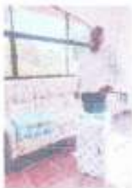
Donación de fruta y verdura Bodega el Puente 01/04/2016