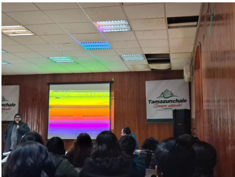
CURSO DPTO PLANEACION Y TRANSPARENCIA