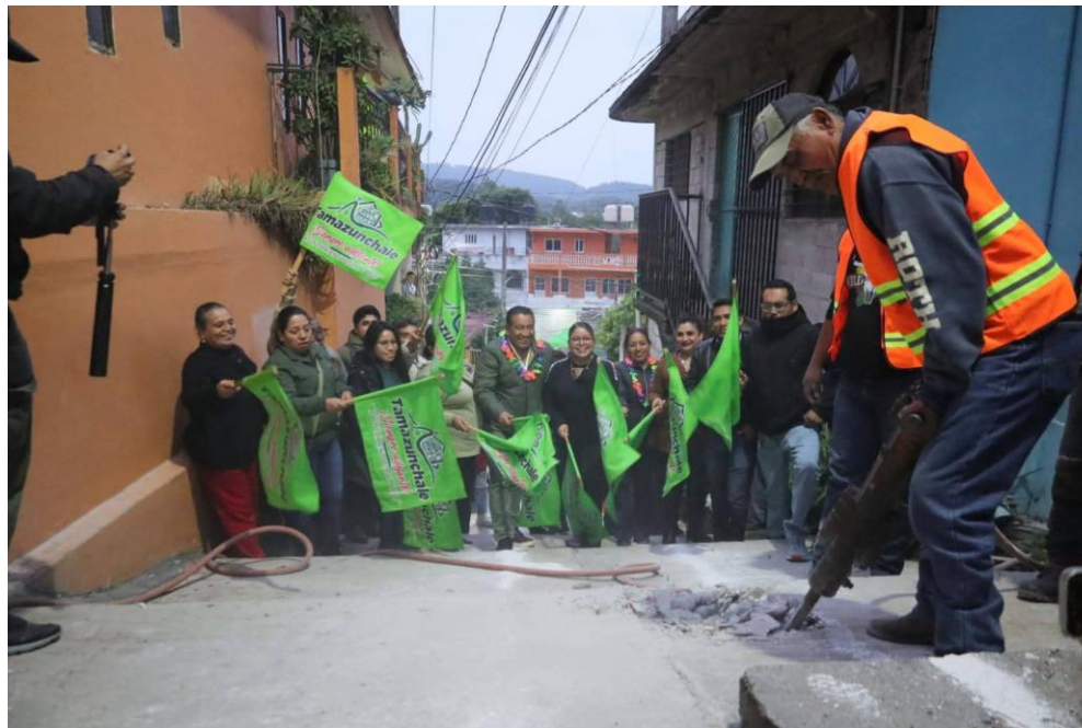
ARRANQUE DE LA OBRA EN LA CALLE CERRADA