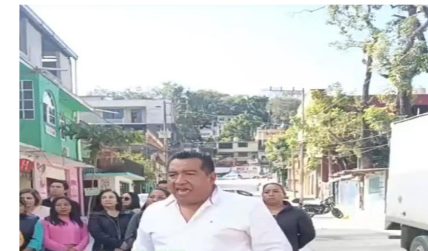
REAPERTURA DE LA CALLE EN EL BARRIO DEL CARMEN BAJADA HACIA EL HOSPITAL CIVIL HUMBERTO ACOSTA VEGA