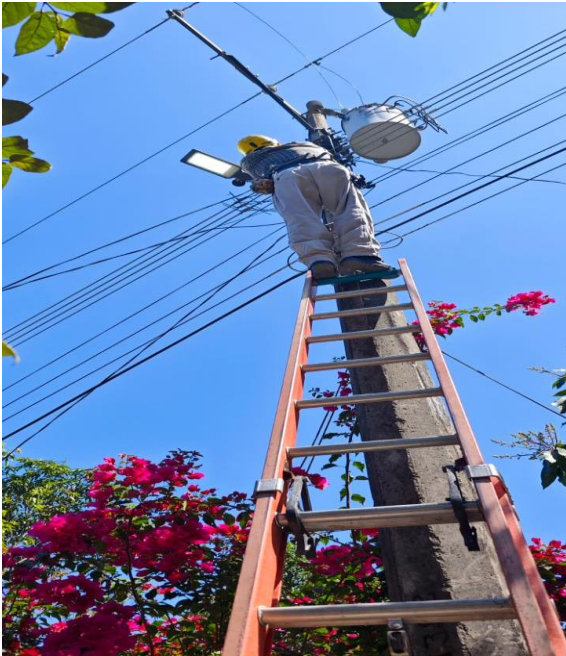
MANTENIMIENTO DE LUMINARIAS COL. NUEVO MEXICO CABECERA MPAL.