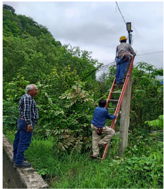
MANTENIMIENTO DE LUMINARIAS BO. DE GUADALUPE TAMAN