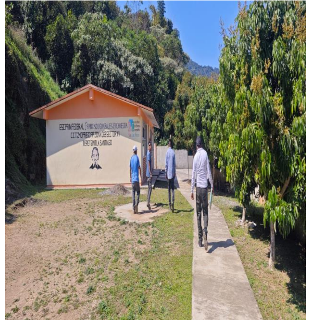
ESC. PRIM. FRANCISCO GONZALEZ BOCANEGRA LOCALIDAD TEPETZINTLA