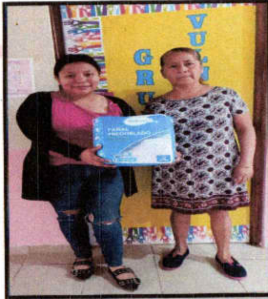
Apoyo de pañales.