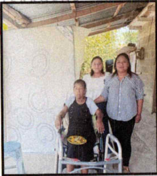
Apoyo de colchon.