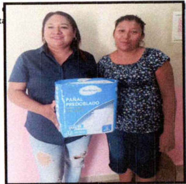
Apoyo de pañales.