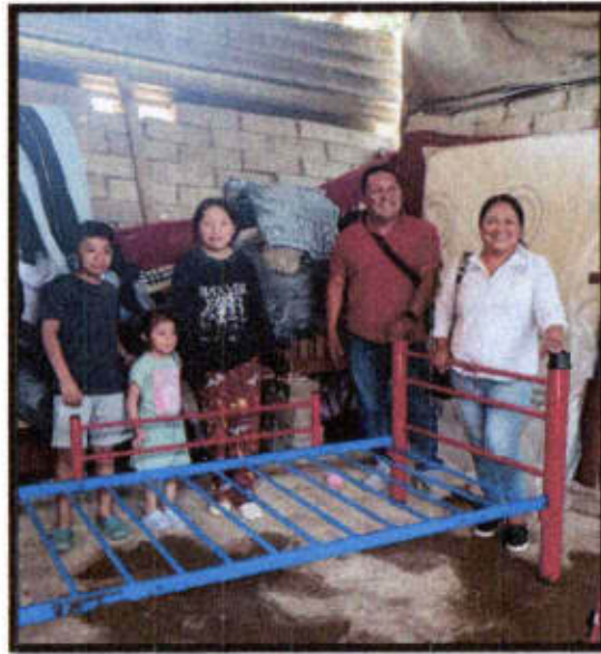
V. D. Loc. Chalco