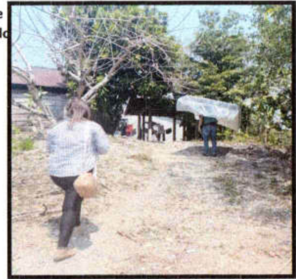
V.D. Loc. Tenexcalco.