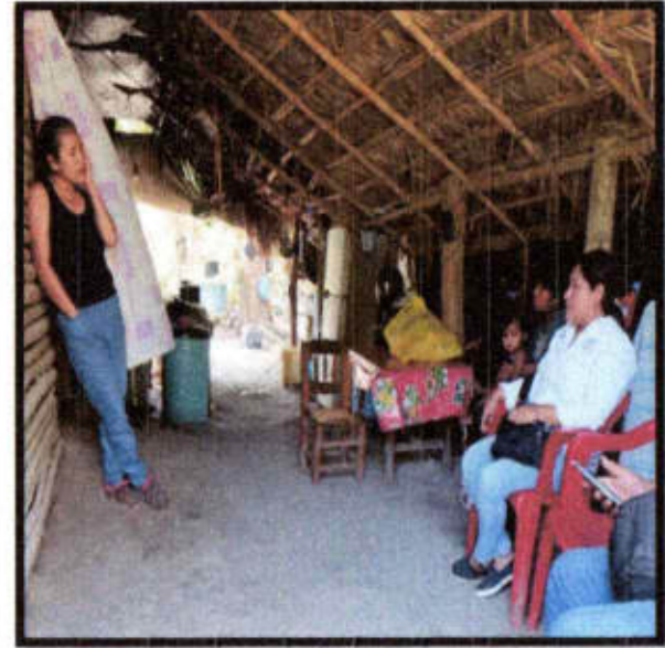
V. D. Loc. Chalco