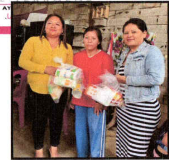
V.D. Loc. Chalco.