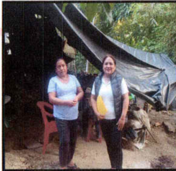
V.D. Loc. Coatzontitla.