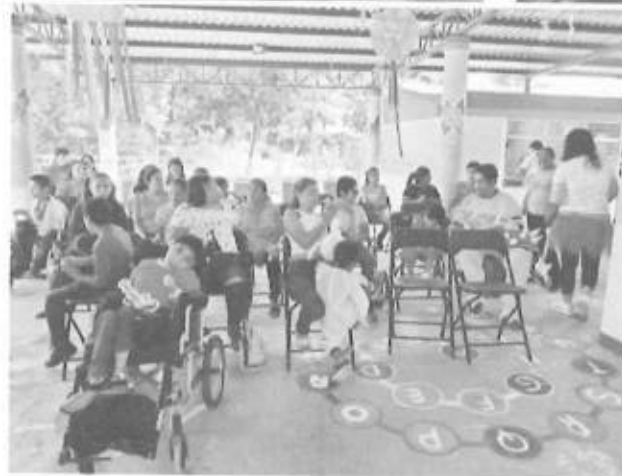
ACTIVIDAD DE FOMENTO A LA LECTURA ALUSIVO A LA PRIMAVERA CENTRO EDUCATIVO CAM

Fuente que alimenta al indicador Que se encuentra estante 2 repisa B expediente 2 informes de productividad