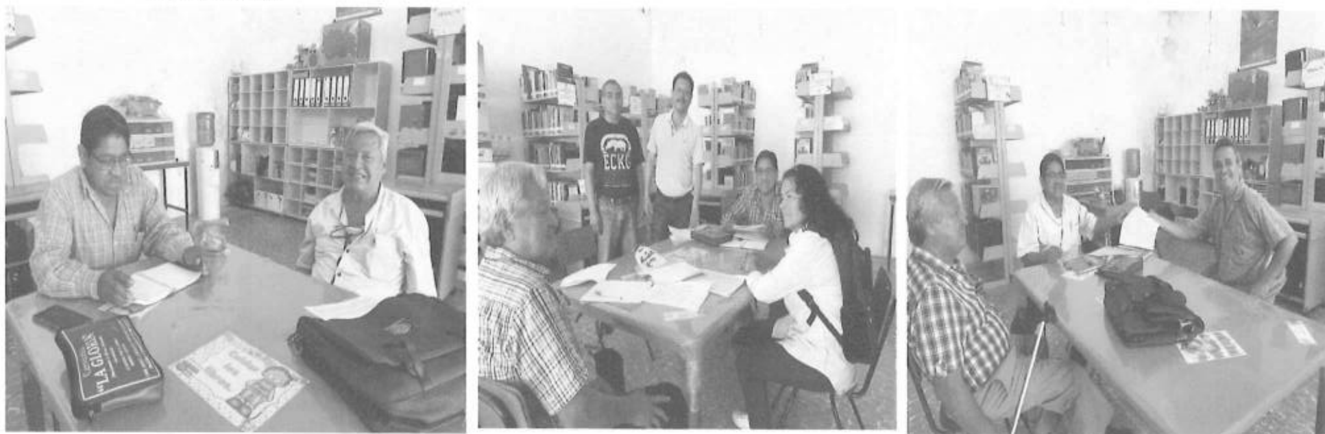
SERVICIOS DE ESPACIOS PARA JUBILADOS Y PENSIONADOS SECCION 26