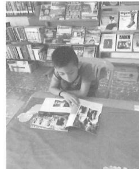
PRESTAMO DE LIBROS A DOMICILIO