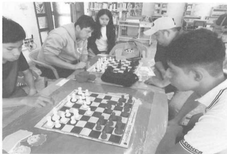
SERVICIOS DE ESPACIOS PARA TALLER DE AJEDREZ, ESCUELA DE DEPORTES

Fuente que alimenta al indicador Que se encuentra estante 2 repisa B expediente 2 informes de productividad