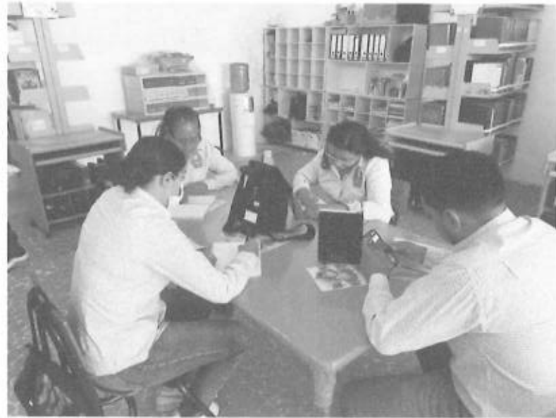
SERVICIOS DE ESPACIOS PARA ADMINISTRADORES DE ALBERGUES DE NUEVO AYOTOXCO CAPACITACION EL LINEA