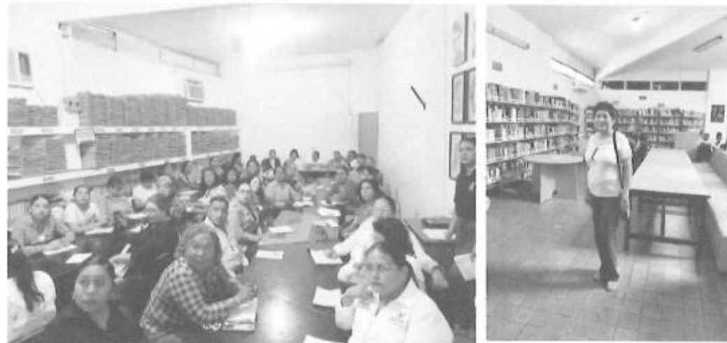
CAPACITACION A PERSONAL BIBLIOTECARIO TALLER DE PRIMAVERA

Fuente que alimenta al indicador Que se encuentra estante 2 repisa B expediente uno oficios enviados y recibidos