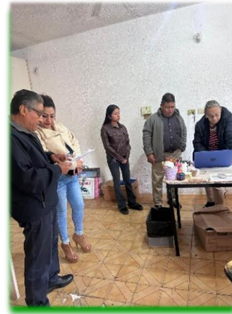
Auditoría Archivo Municipal