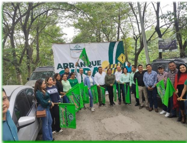
Arranque de obra pavimentación acceso ENESMAPO