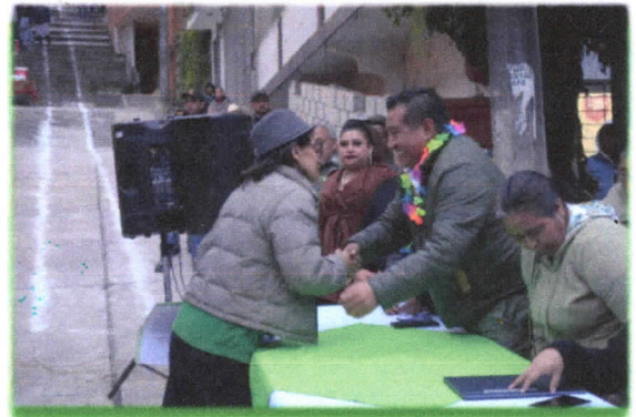
Renovación de calle Cerrada Juárez" en la colonia XEW