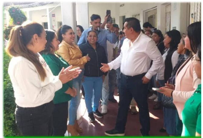
Entrega de Medicamentos a la Coordinación de Salud