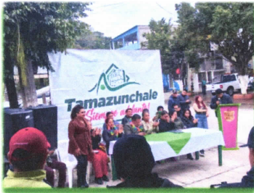
Renovación de calle Cerrada Juárez" en la colonia XEW