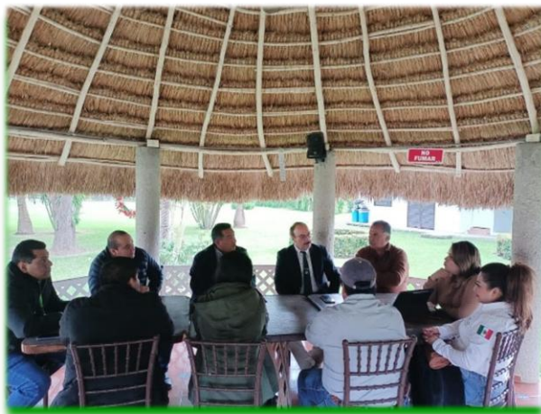
Reunión de trabajo con ENESMAPO