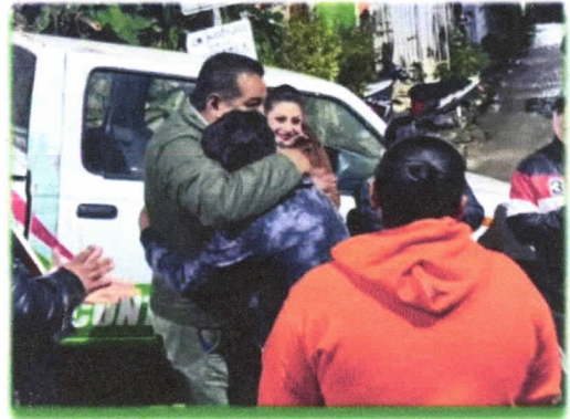
Entrega de cobijas a diversas comunidades