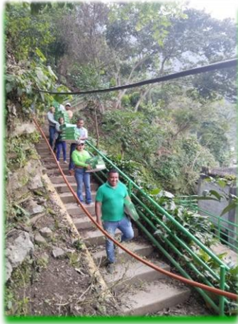
Entrega de roscas diversas comunidades