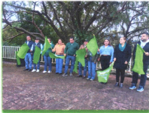
Rehabilitación de áreas recreativas en la UDETA