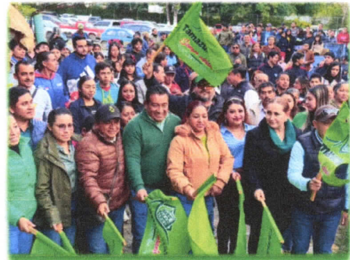
Rehabilitación de áreas recreativas en la UDETA