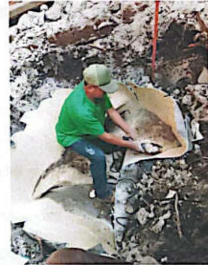
CENTRO DE PREESC. INDIG. "JOSE LOPEZ PORTILLO", MAPOTLA.