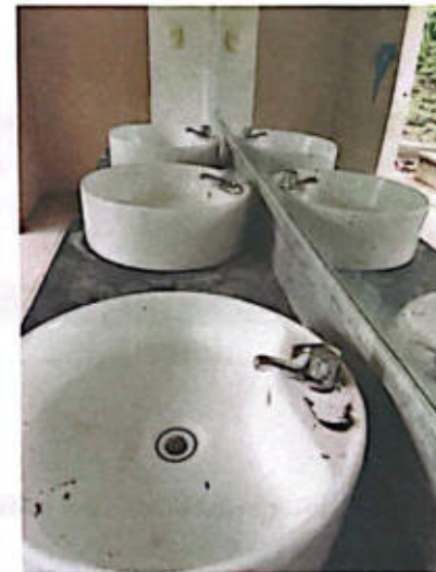
ESC. PRIM. "MARGARITA MAZA DE JUÁREZ", AXTLA