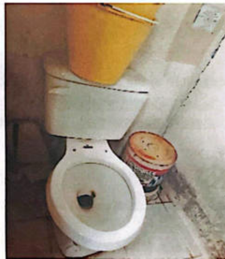
Sanitarios del Edificio de Seg. Púb. Mpal.