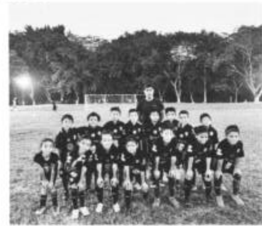
GANADORES DEL PRIMERO Y SEGUNDA LUGAR DE LA COPA AXTLA