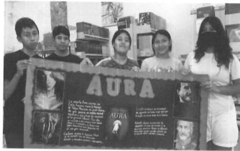
LOS ALUMNOS DEL COBACH 33SERVICIO DE CONSULTA E INVESTIGACION