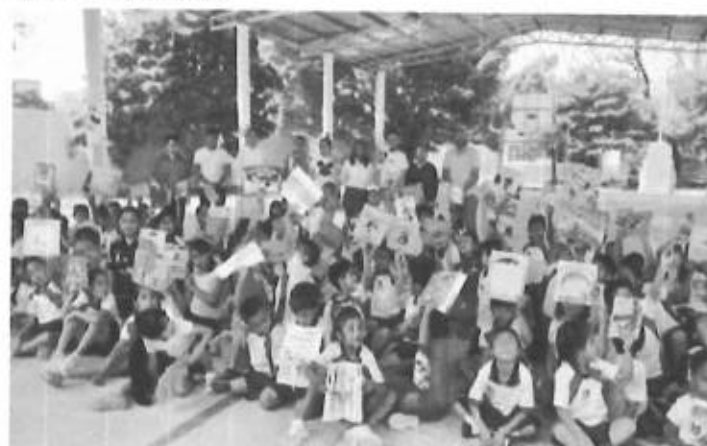
CELEBRACION DEL DIA INTERNACIONAL DEL LIBRO CON ALUMNOS DE 1° A 6° DE LA ESC. PRIM. JOSE MARIA PINO SUAREZ DE TAMPOCHOCHO

Fuente que alimenta al indicador Que se encuentra estante 2 repisa B expediente 2 informes de productividad