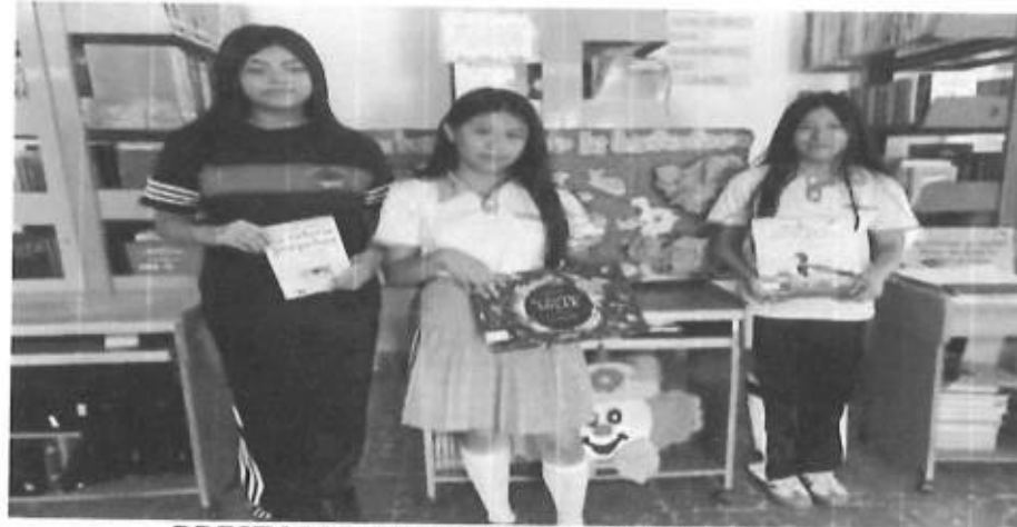
PRESTAMO DE LIBROS A DOMICILIO

Fuente que alimenta al indicador Que se encuentra estante 2 repisa B expediente 2 informes de productividad