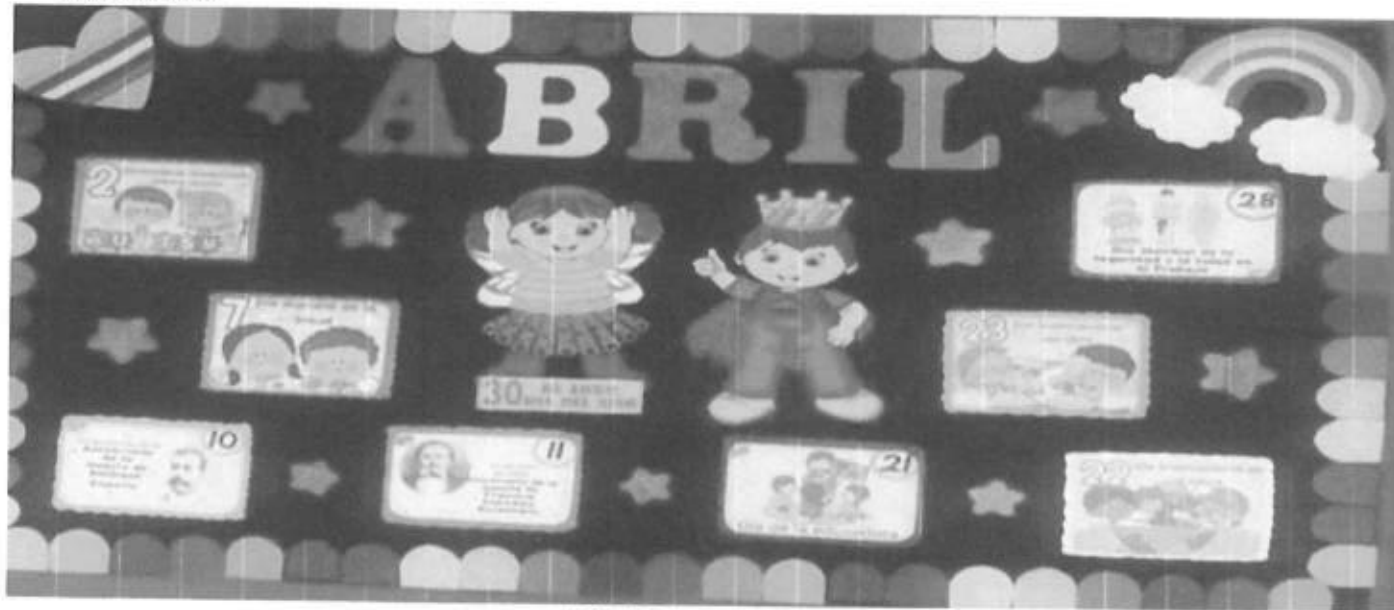
PERIODICO MURAL MES DE MARZO

Fuente que alimenta al indicador Que se encuentra estante 2 repisa B expediente 2 de productividad