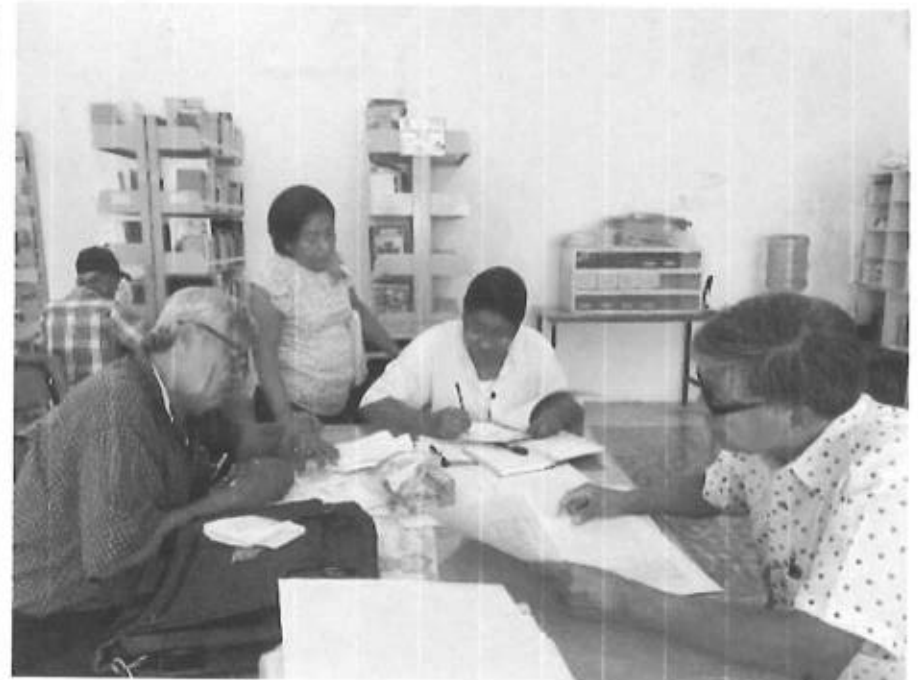
SERVICIOS DE ESPACIOS PARA JUBILADOS Y PENSIONADOS SECCION 26