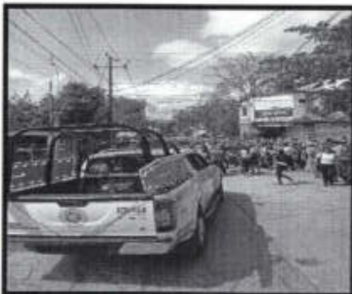
Se brindó vialidad en el evento religioso con motivo del "domingo de ramos".