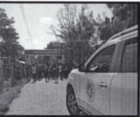
Se brindó apoyo en una carrera atlética de la Esc. Prim. Herminio Salas Gil, de la localidad de Santa Fé Texacatl.