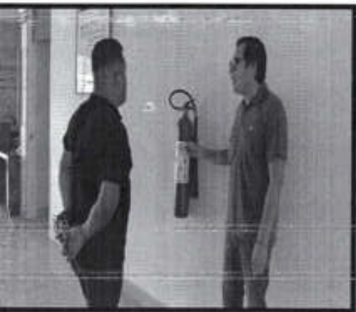
Se realizaron verificaciones a establecimientos comerciales para otorgar las constancias de verificación.