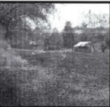
Se combate incendio en un domicilio en la localidad de Amamila, a consecuencia de la quema de basura.