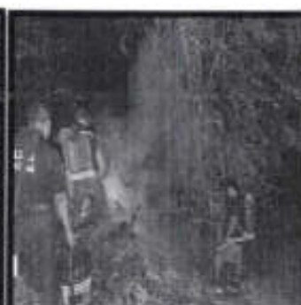
Se combate incendio en una parcela.

ESTA INFORMACION SE ENCUENTRA UBICADA: EN LA REPISA 1- A (ACCIONES REALIZADAS/ACCIONES PROGRAMADAS) *100 META ANUAL: 15 META ALCANZADA: 10