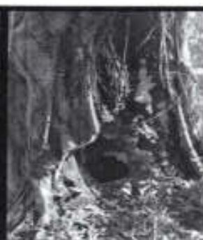
Se atiende reporte de un árbol incendiándose en la Y griega.