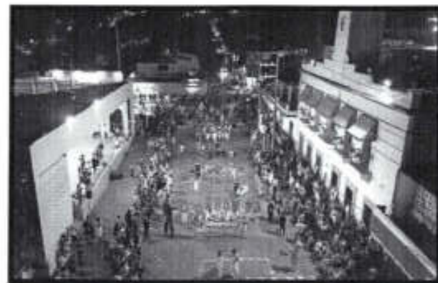
Se brindó apoyo en el carnaval 2026.

ESTA INFORMACION SE ENCUENTRA UBICADA: EN LA REPISA 1- A (ACCIONES REALIZADAS/ACCIONES PROGRAMADAS) *100 META ANUAL: 90 META ALCANZADA: 21