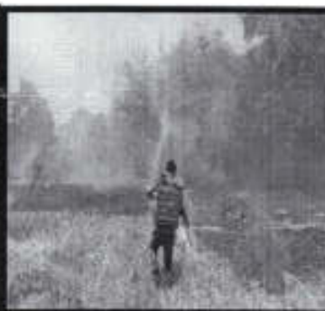
Se combate incendio en un pastizal en la localidad de Tenexcalco.