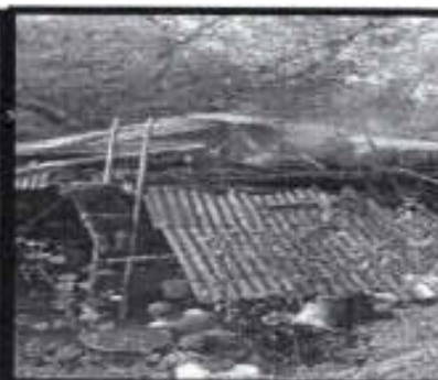
Se acude a un reporte de un incendio en la localidad de Zacayuhuatl.