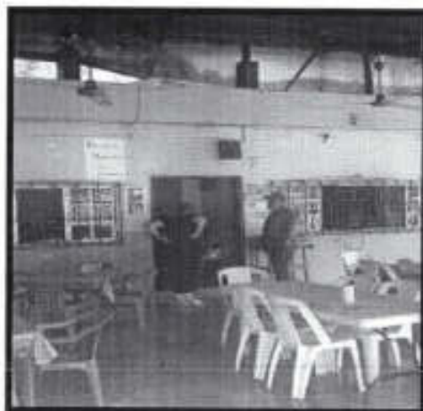
Se realizó una verificación en el negocio "el taco loco" ubicado en la Y griega, localidad de Rancho Nuevo.