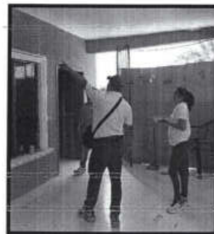
Se continúan visitando establecimientos y lugares públicos para sus verificaciones correspondientes.