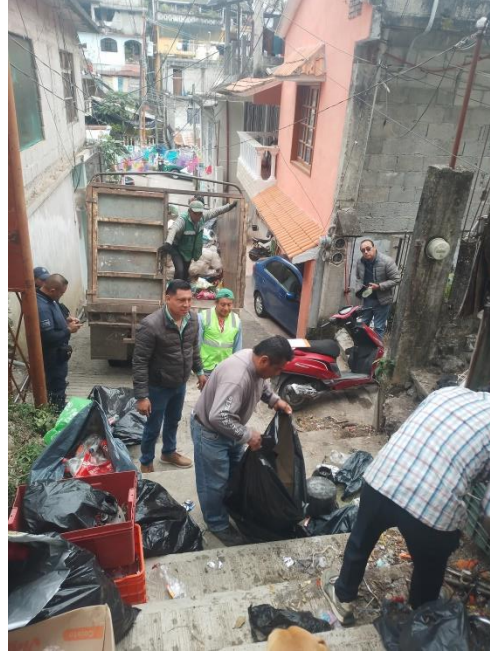
Foto 1.- mesa de trabajo con personal de PROFEPA, tema: caza furtiva Foto 2.- rescate de área con acumulación de basura en vía pública ( San Rafael)