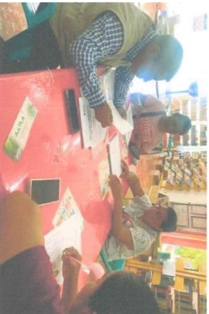
SERVICIOS DE ESPACIOS PARA INEA COORDINACION REGIONAL TAMAZUNCHALE