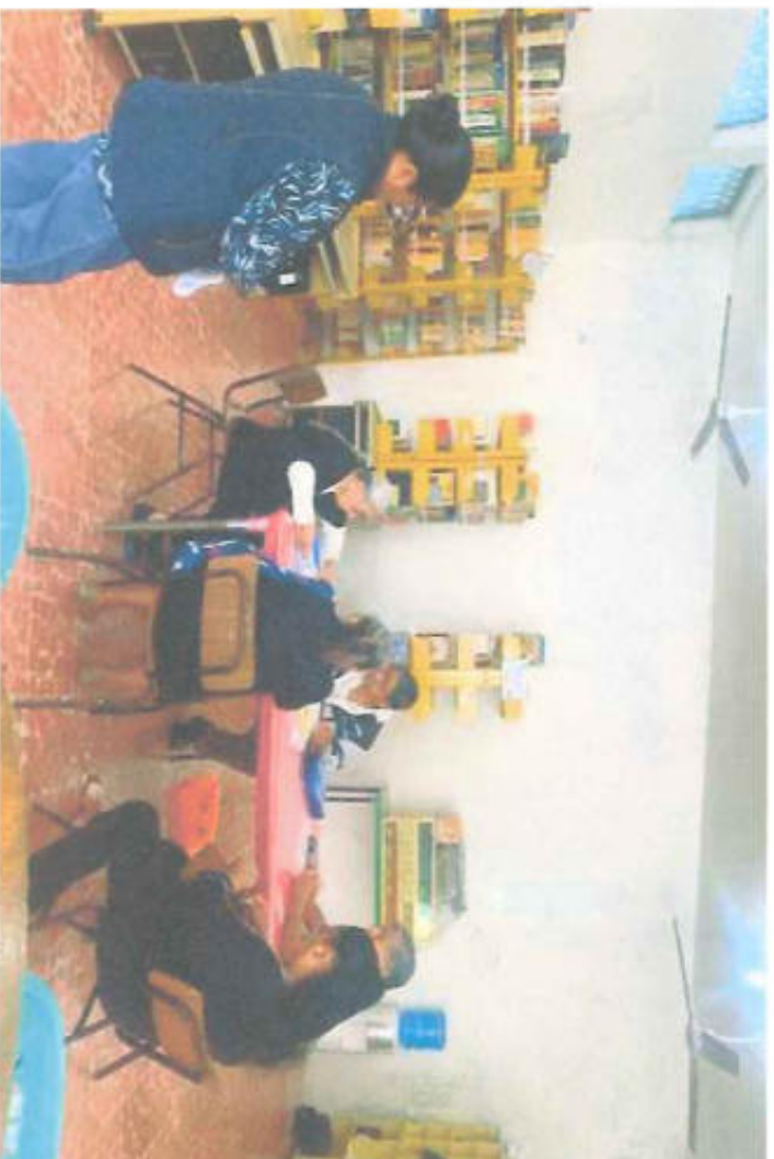
SERVICIOS DE ESPACIOS PARA JUBILADOS Y PENSIONADOS