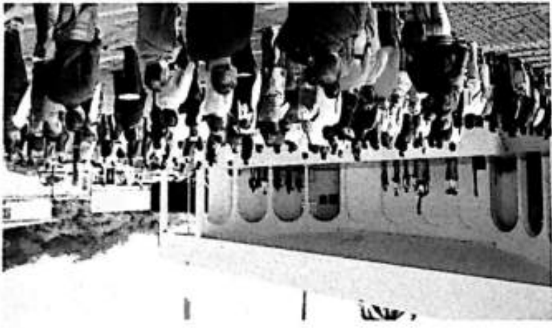
El día 09 de febrero del 2026 se realizó los honores a nuestro labaro patrio, dirigidos por el departamento de Protección Civil.