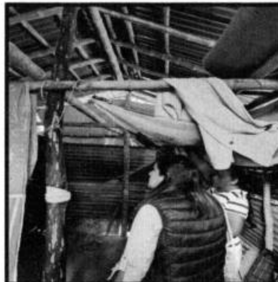
V.D. EJIDO COAMILA.