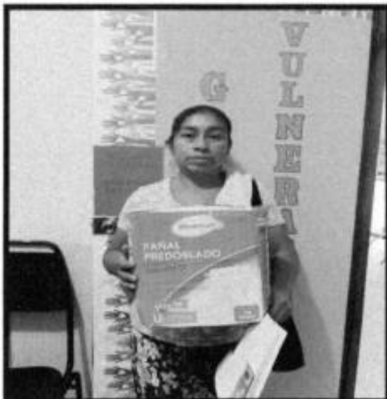
APOYO DE PAÑALES.