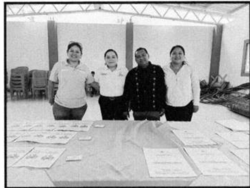
FERIA DE SERVICIOS EN LA LOC. DE TEMALACACO.