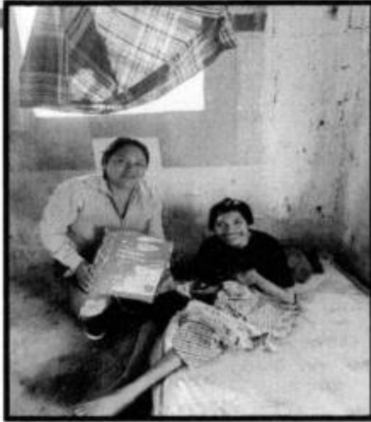
APOYO DE PAÑALES.