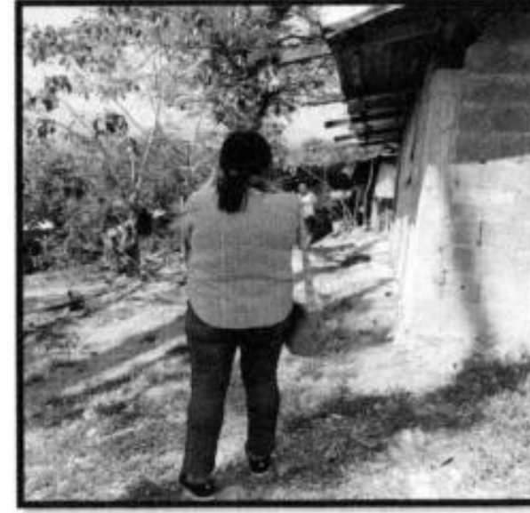
V.D. LOC. TENEXCALCO.