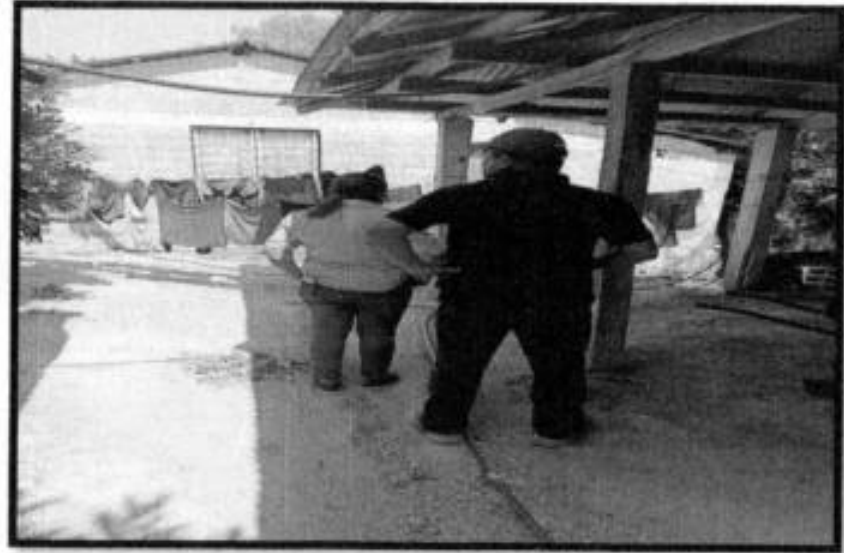
V.D. LOC. TENEXCALCO.