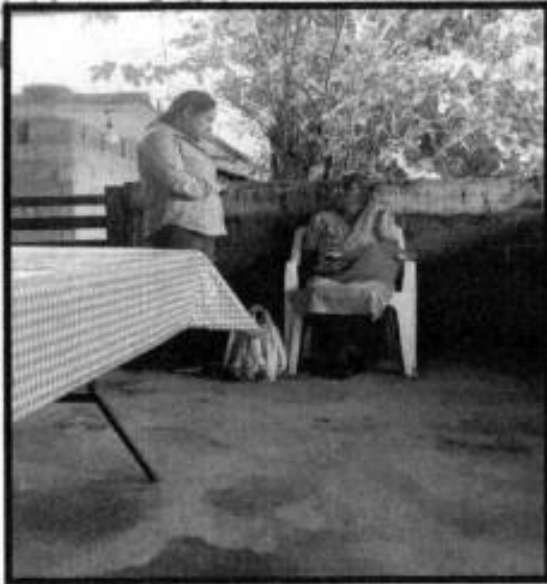
V. D. LOC. TENEXCALCO.