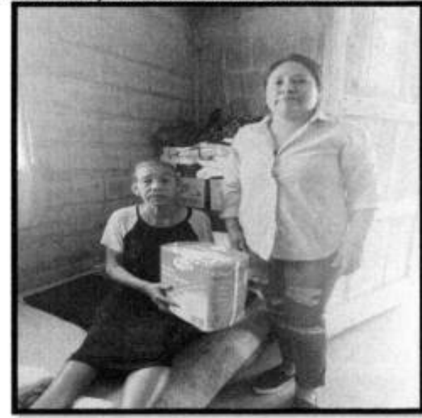
APOYO DE PAÑALES.

UBICACION: SE ENCUENTRA UBICADO EN LA REPISA 1-A META ANUAL: 75 APOYOS SOCIALES. META ALCANZADA: 14 APOYOS SOCIALES.