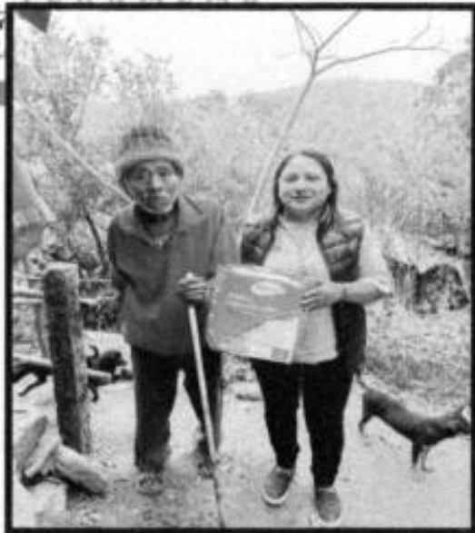
APOYO DE PAÑALES.