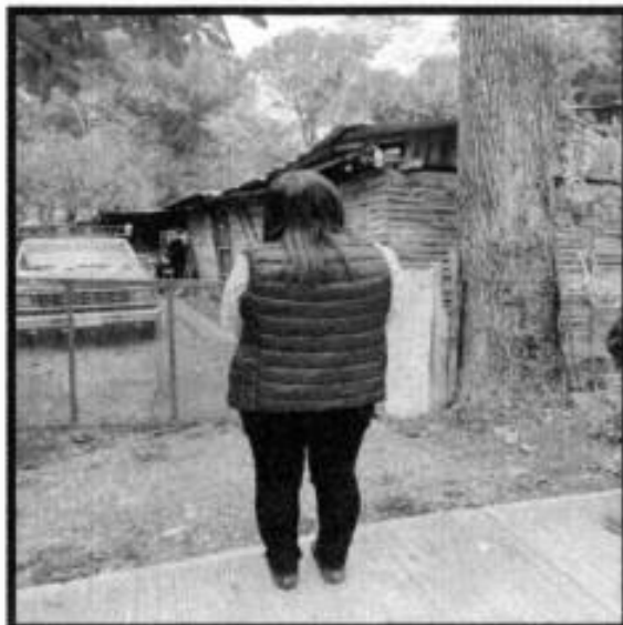
V.D. EJIDO COAMILA.