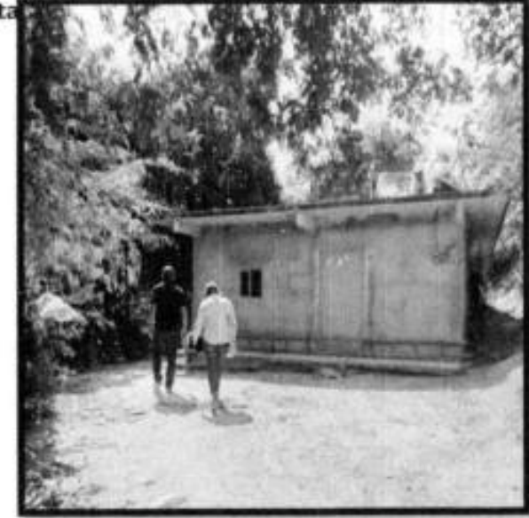
V.D. LOC. TENEXCALCO.