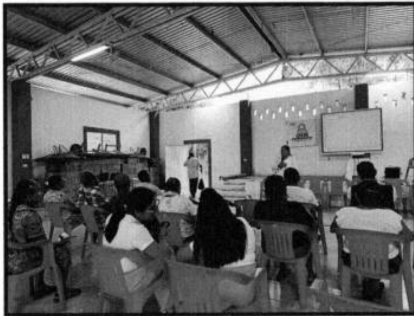
PLATICAS EN LA LOC. DE TEMALACACO.