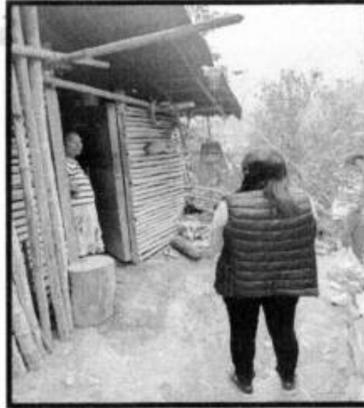
V.D. EJIDO COAMILA.