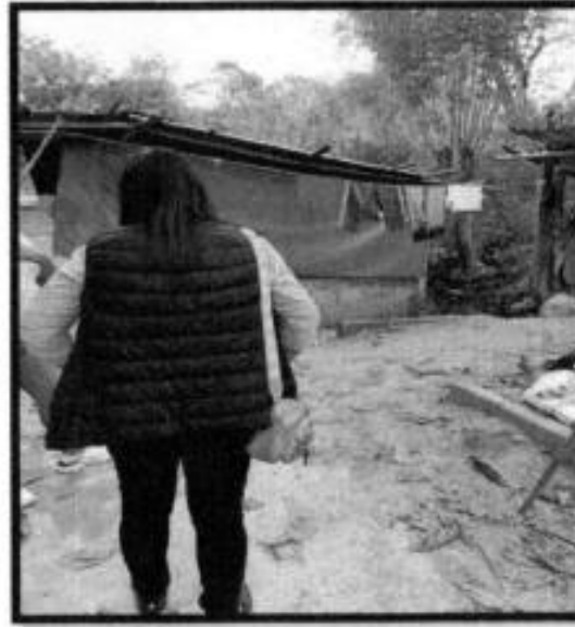
V.D. EJIDO COAMILA.