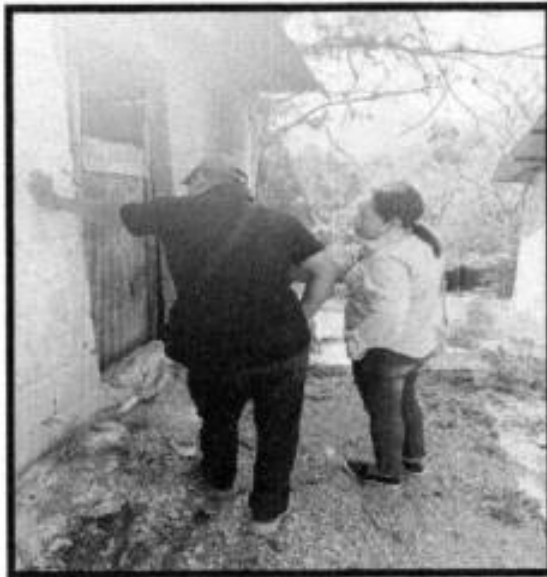
V. D. LOC. TENEXCALCO.