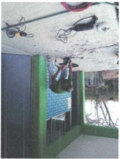
COBACH 33 AXTLA Apoyo con mano de obra eléctricos y plomería