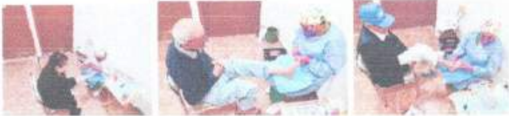
Agua purificada 27/02/2026