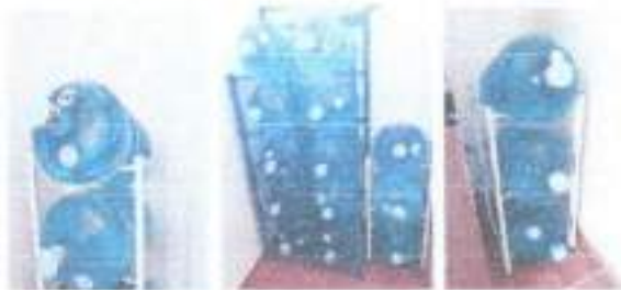
Verificación del agua clorada por Secretaria de Salud 02/03/2016