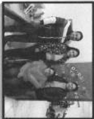
Pie de foto: Entrega de silla de ruedas a persona con discapacidad de la localidad de Cuayo Cerro.