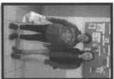
Apoyo social con Despensas