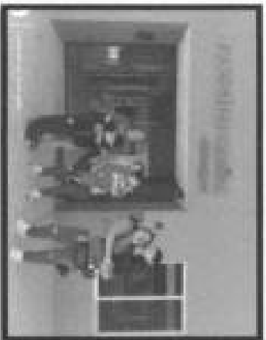
Apoyo social con Traslados