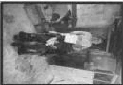
Pie de foto: Entrega de silla de ruedas a persona con discapacidad de la localidad de La Purísima.