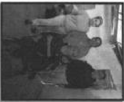
Pie de foto: Entrega de silla de ruedas a persona con discapacidad de la localidad de Cuayo Cerro.