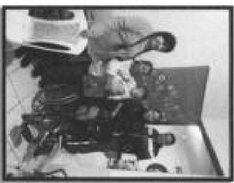
Pie de foto: Entrega de silla de ruedas infantil a persona con discapacidad de la localidad de Isabella.