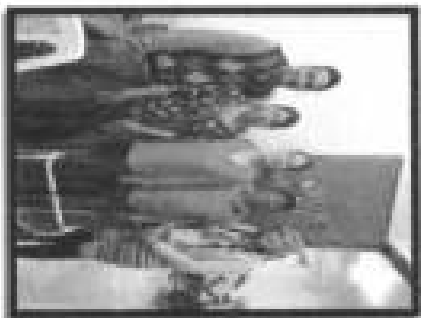
Pie de foto: Entrega de andador a una persona con discapacidad de la localidad de Chalco.