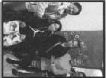
Pie de foto: Entrega de silla de ruedas a persona con discapacidad de la localidad de Ensenada Chalco.