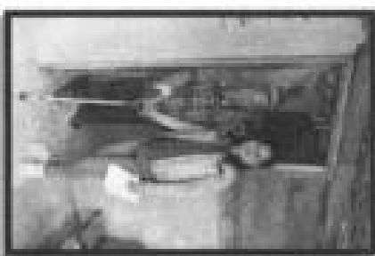
Pie de foto: Entrega de bastón de un pie a persona con discapacidad de la localidad de Rancho Nuevo.