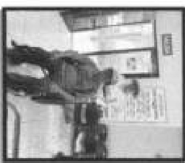
Pie de foto: Entrega de silla de ruedas a persona con discapacidad de la localidad de