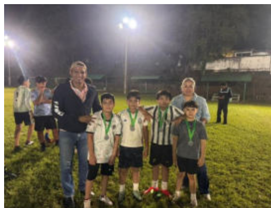
Imagen de los ganadores del Encuentro Deportivo de Mamás.