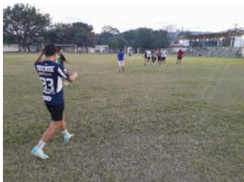
Entrenamiento semanal de la disciplina de futbol.