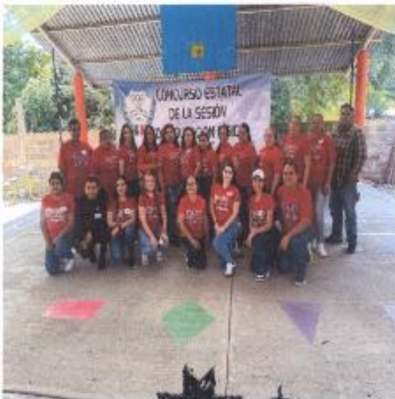
RECOPIACION DE VALES DE ZAPATOS Y MOCHILAS