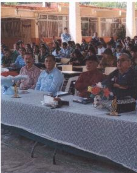
PACTICIPACION EN ACTIVIDADES ESCOLARES