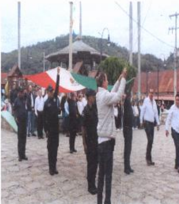
HONORES A LA BANDERA