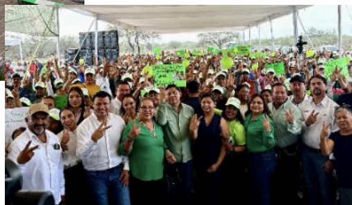
Entrega de Certificados de Lotes a Beneficiarios en Rioverde.

Asistencia de los Titulares de: CEFIM, INREVIS, IRC, SEDUVOP, CEA, y SEDESORE.