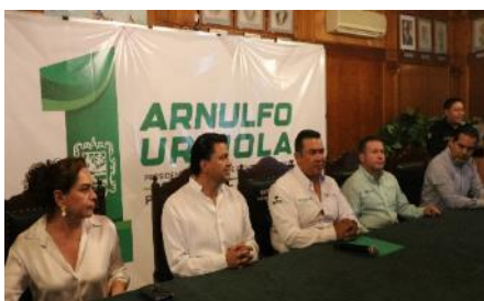
Acto Protocolario de la Donación de Predio del Municipio de Rioverde.

CEFIM, Presidente Municipal de Rioverde, e INREVIS.