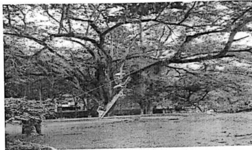
Se brinda atención apoda de árboles en Libramiento J. Jesus Trejo Tramo antiguo cargadero.