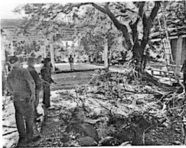
Se brinda atención apoda de árboles en Esc.Sec. Cuahutemoc Loc.Jalpilla