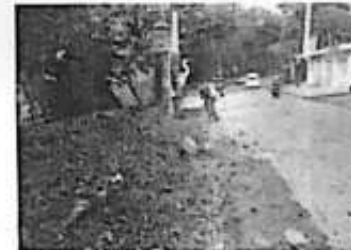
Chapoleo en área que se ubica la fuente salida de la calle Morelos.