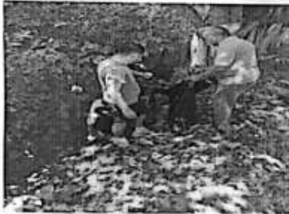
Recolección de basura Túnel Surrealista Tramo Axtla- Comoca.