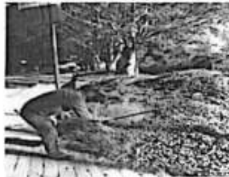
Chapoleo en áreas Túnel Surrealista Tramo Axtla- Comoca.