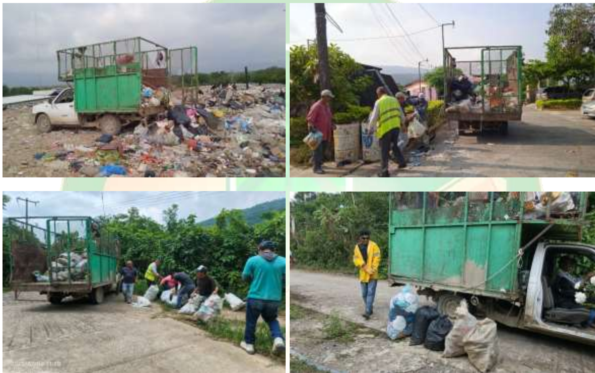
(Ilustraciones.- Recolección de basura en los municipios de Tancahuitz)