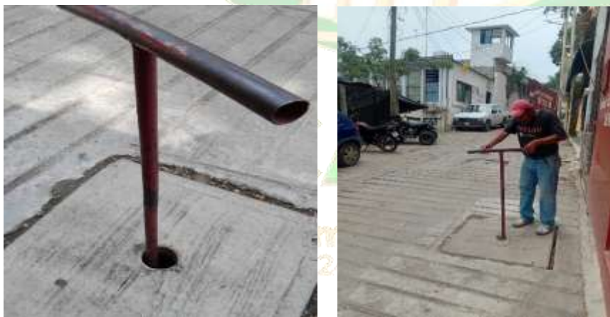
(Ilustraciones.- Alternando agua potable para que todos tengan acceso a ella)