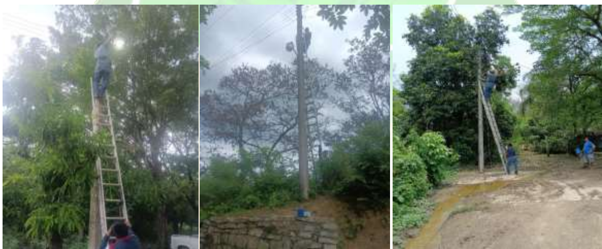
(Ilustraciones.- Cambios de focos y fotoceldas en cabecera municipal)

COMPONENTE/ACTIVIDAD: C2A5 Reparación e instalación de alumbrado público en escuelas y edificios públicos del municipio