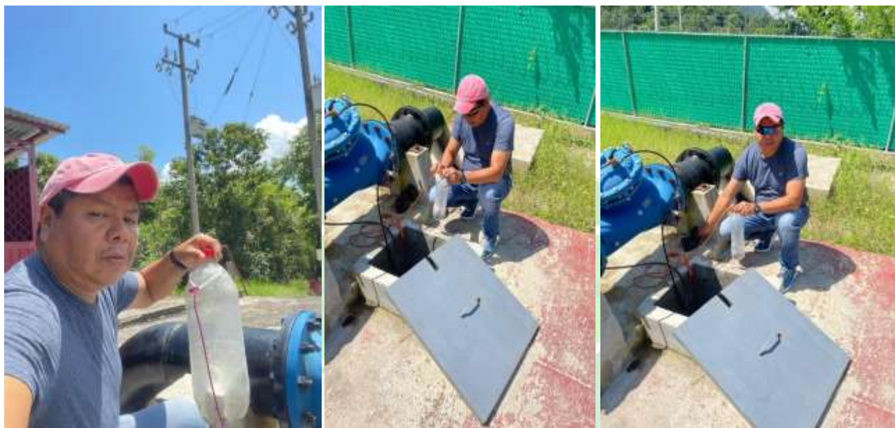
(Limpieza y mantenimiento de los tinacos de almacenamiento de agua potable)