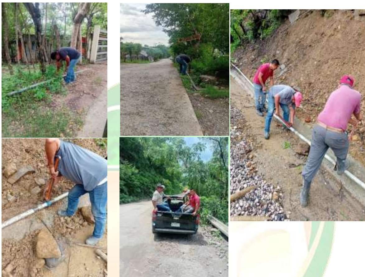
(Reparación de fugas en la línea de conducción)