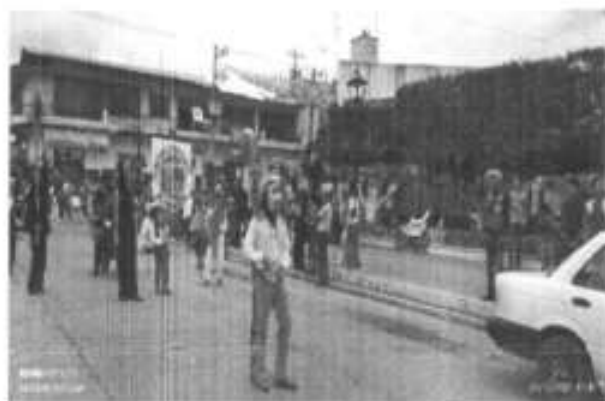
Apoyo en el desfile de concurso de Comparsas.