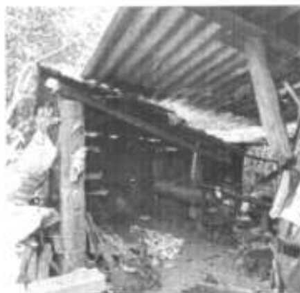
incendio en una casa habitación colonia jacarandas.