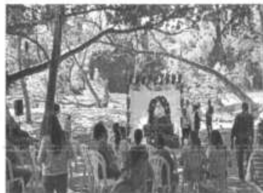
Apoyo en la ribera del río evento de médicos Tradicionales