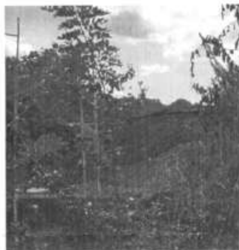
Incendio de vivienda en la localidad de Tampococho.

(ACCIONES REALIZADAS/ACCIONES PROGRAMADAS) *100