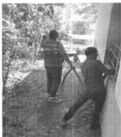
Incendio en la localidad de Jalpilla Casa habitación.

En el mes de octubre se atendieron 4 reportes de incendio.