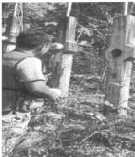
Conato de incendio de una Mufa en la localidad de Cuayo cerro.