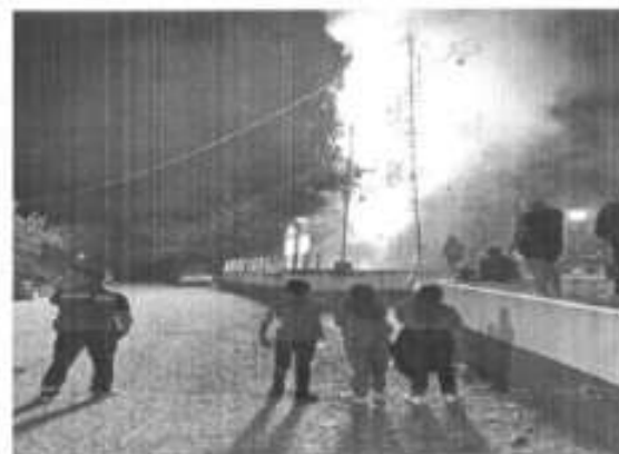
Apoyo de primeros auxilios en la localidad De Cuayo Chalco cambio de fiscal.

(ACCIONES REALIZADAS/ACCIONES PROGRAMADAS) *100 ESTA INFORMACION SE ENCUENTRA UBICADA: EN LA REPISA 1- A META ANUAL: 59 META ALCANZADA: 50