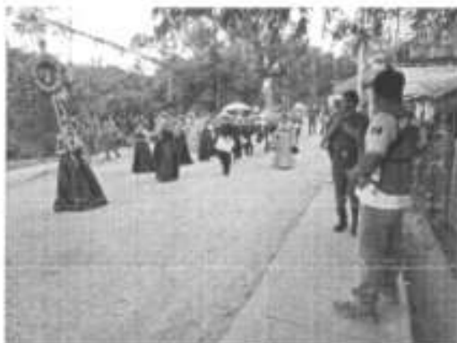
Apoyo en el desfile de Xantolo de las escuelas del municipio.

En el mes de Octubre se realizaron 4 visitas de vigilancia de protección civil a espectáculos públicos.