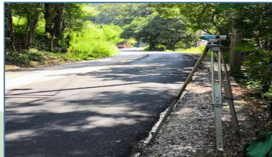
C2A2: Levantamiento topográfico para la creación de proyecto de obra de infraestructura.