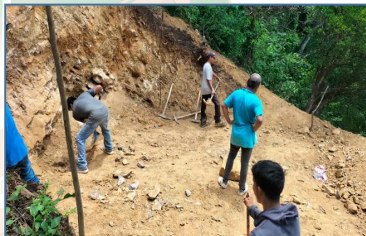
C4A1: Supervisión a las obras de infraestructura realizadas en comunidades y cabecera municipal de Tancanhuitz. S.L.P.