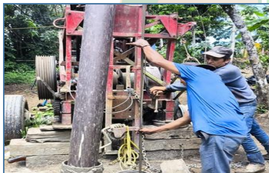
C2A1: Realización de proyectos de infraestructura en beneficio de las localidades del Municipio de Tancanhuitz.