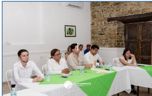
C1A1: Realización de reuniones de consejo para la priorización y supervisión de apoyos sociales y obras de infraestructura.