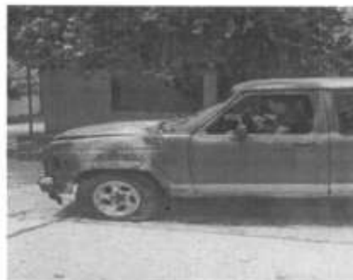
camioneta incendiándose en la calle hidalgo