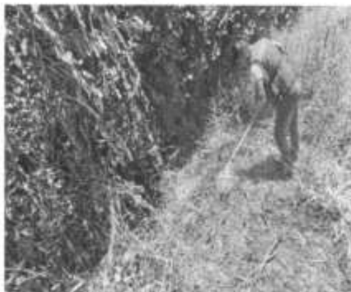
conato de incendio en la localidad de Jalpilla

En el mes de septiembre se atendieron dos reportes de incendio.