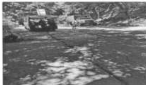
vialidad en la carretera Axtla – comoca

En el mes de septiembre se realizaron cinco visitas de vigilancia de protección civil a espectáculos públicos.