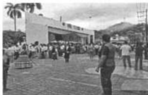
Desfile conmemorativo 215 aniversario de independencia.