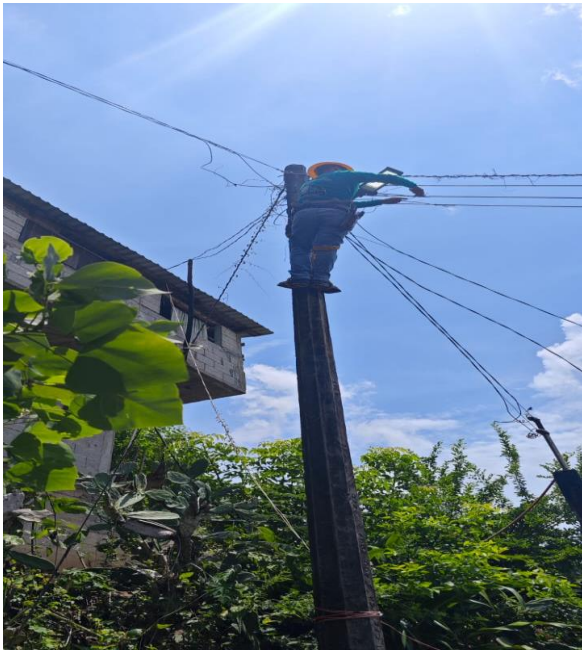
CHILOCUIL MANTENIMIENTO DEL ALUMBRADO