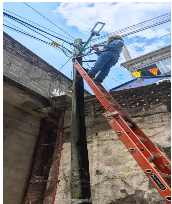
BARRIO DEL CARMEN ALTOS MANTENIMIENTO DE LUMINARIAS.