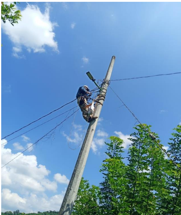
ATLAJQUE MANTENIMIENTO DEL ALUMBRADO