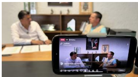
Atención a Medios de Comunicación. Entrevista con el Periódico “Acción”.