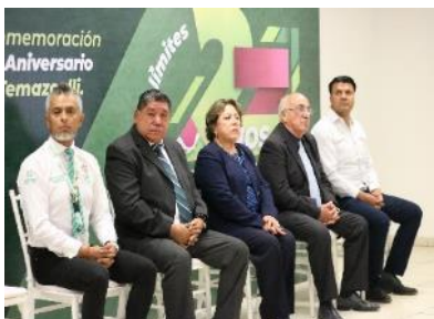
El Titular de Cefim acudió al Aniversario 27 del Instituto Temazcalli.

Reunión con el INEGI , para dar a conocer la próxima “ Encuesta Intercensal 2025 ” que se aplicará en los 59 Municipios del Estado del 6 de octubre al 14 de noviembre.