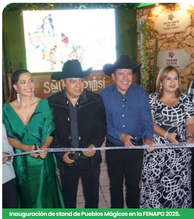
Inauguración de stand de Pueblos Mágicos en la FENAP 2025.

Durante el periodo que se informa, poco más de 112 mil personas visitaron los atractivos culturales, históricos y naturales que los seis Pueblos Mágicos de la Entidad ofrecen.