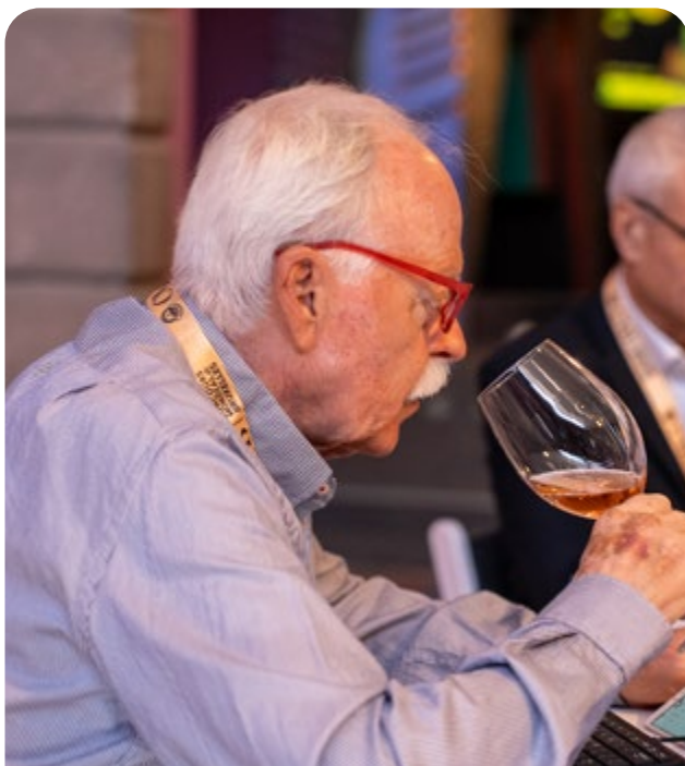
México Selection by CMB presentado por AUDI.

Derivado de lo anterior, y sumado al gran momento que vive la industria vitivinícola de la Entidad, el Concours Mondial de Bruxelles (CMB) inspiró a la realización en la ciudad de San Luis Potosí de la 8ª edición del concurso de vinos y espirituosos.