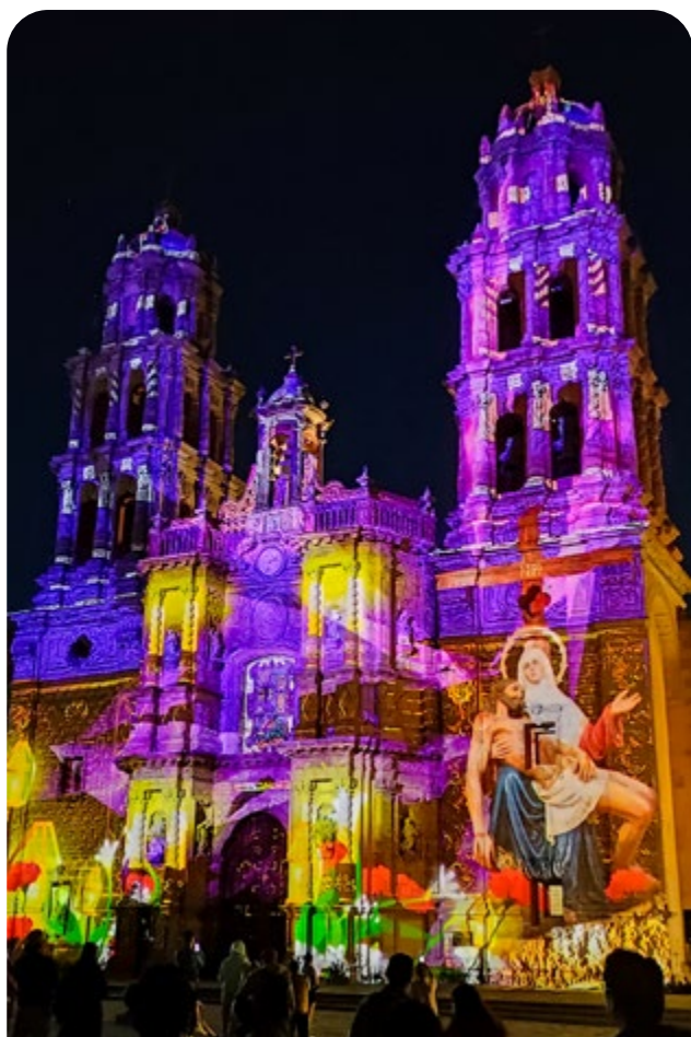
Fiesta de luz en la capital potosina.

Uno de los eventos que ha fortalecido la imagen cultural del centro histórico de la capital potosina durante las principales temporadas de mayor afluencia a la Entidad, es sin lugar a dudas la Fiesta de Luz , que en este periodo durante la pasada temporada de invierno con la obra Fiesta de Invierno y durante la Semana Santa con la obra Regiones , pudieron disfrutar más de cien mil espectadores frente a la fachada de la Catedral Metropolitana de San Luis Potosí donde fueron proyectadas.