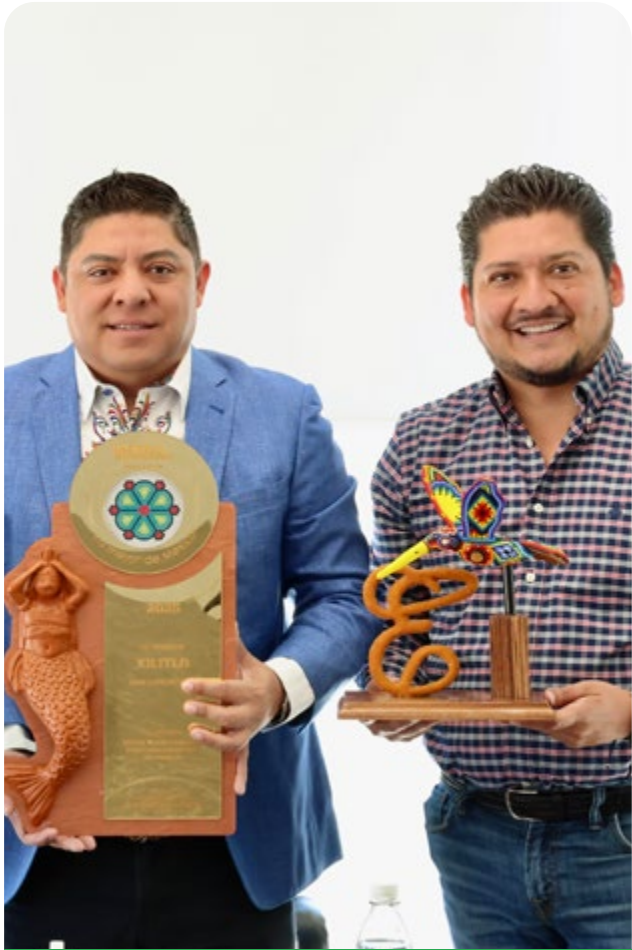
Reconocimientos turísticos para Xilitla.

Con el objetivo principal de promover y dar visibilidad al gran talento artesanal potosino, se inauguró el espacio Raíces Potosinas en la sede de la Secretaría de Turismo ubicada en la ciudad de San Luis Potosí.