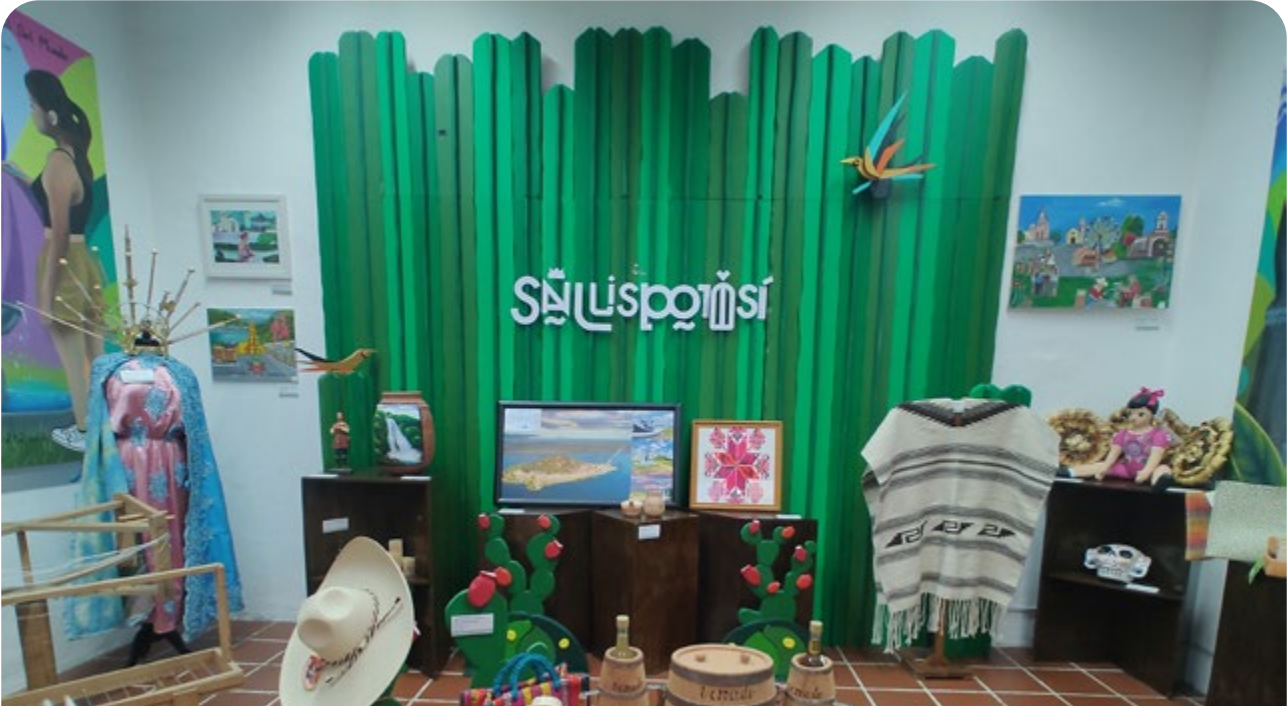
Museo Raíces Potosinas en la sede de la Secretaría de Turismo en la capital del Estado.