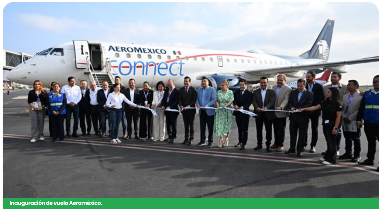
Inauguración de vuelo Aeroméxico.

Durante el primer semestre del 2025 se incorporaron nuevas rutas aéreas en el Aeropuerto Internacional Ponciano Arriaga: TAR Aerolíneas añadió conexiones con destino a las ciudades de Monterrey y Querétaro; de igual forma Aerus diariamente conecta al AIFA-CDMX; la alianza Aeroméxico Delta integró la ruta diaria a la ciudad de Atlanta y Volaris opera tres vuelos semanales a Houston, Dallas-Fort Worth y San Antonio, lo que fortalece segmentos estratégicos de la Entidad con el mercado norteamericano.