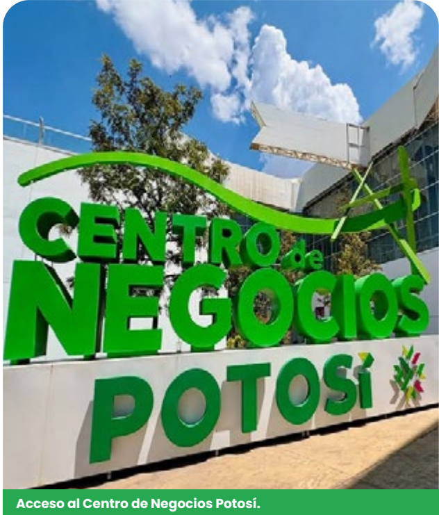
Acceso al Centro de Negocios Potosí.

Algunos eventos a destacar fueron: el LVI Congreso Mexicano de Anestesiología , Asambleas de Circuito de Testigos de Jehová , Congreso ADERAC y la Expo Caballos Americanos , entre otros.