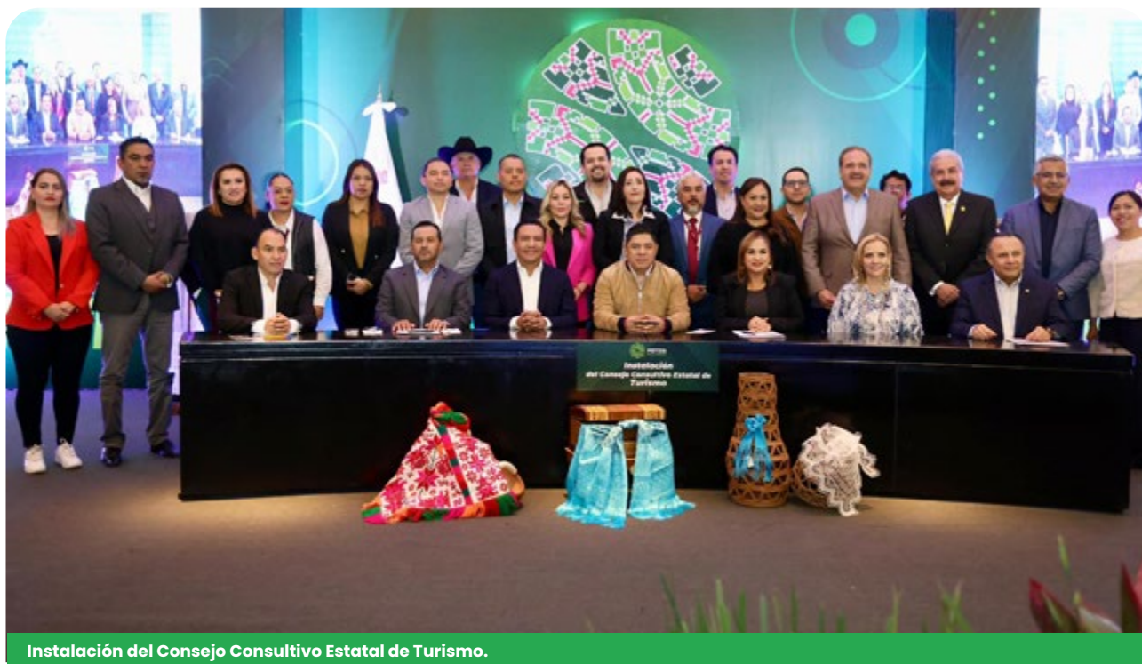
Instalación del Consejo Consultivo Estatal de Turismo.

Durante el periodo que se informa, se instaló el Consejo Consultivo Estatal de Turismo, como lo dispone la Ley en la materia, además de instalarse 58 consejos municipales de turismo.