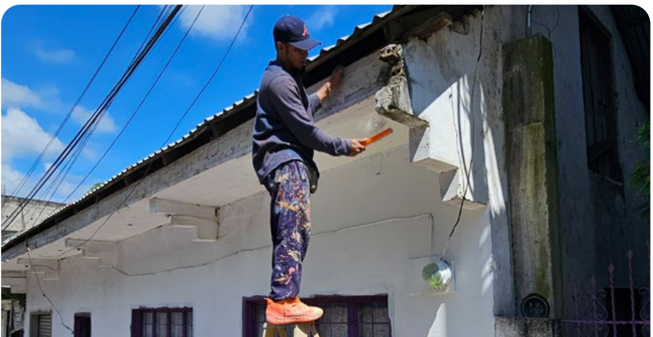
Pintura de fachadas en Xilitla.

Aunado a ello, continúan los trabajos para implementar el programa Rutas Mágicas del Color , operado por la Secretaría de Turismo federal en varios municipios. En este periodo, concluyó la intervención en San Cirio de Acosta, y dentro de la vertiente Pintura de Fachadas de dicho programa, fue definido el polígono a intervenir en el municipio de Xilitla y en el Barrio Mágico de Tlaxcala. Asimismo, se apoya a los ayuntamientos de El Naranjo, Lagunillas, Matlapa, Santa Catarina y Tampamolón Corona con la asesoría pertinente para facilitar su incorporación al programa.