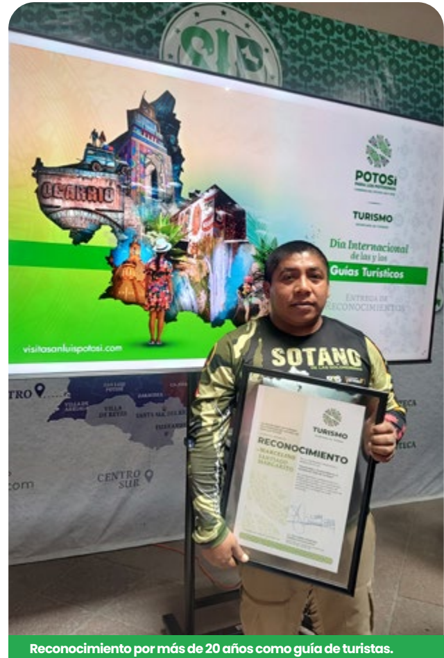
Reconocimiento por más de 20 años como guía de turistas.

En el marco de la celebración del Día Internacional del Guía de Turistas , se llevó a cabo la entrega de trece reconocimientos de los guías certificados que operan en la Entidad destacando la trayectoria de