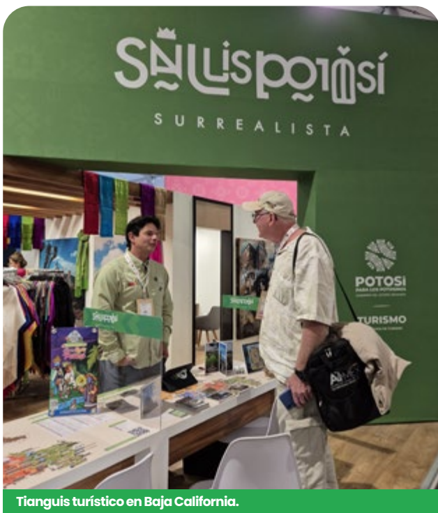
Tianguis turístico en Baja California.

Por otra parte, en su edición 49 el Tianguis Turístico con sede en el estado de Baja California se consolidó como la plataforma nacional más importante de promoción y comercialización del turismo. Este evento, el primero con carácter mexico-americano, tuvo actividades programadas en Baja California y San Diego (California), y San Luis Potosí fortaleció su presencia en los mercados nacionales e internacionales, y generó nuevas alianzas estratégicas que impactan directamente en el crecimiento del turismo.