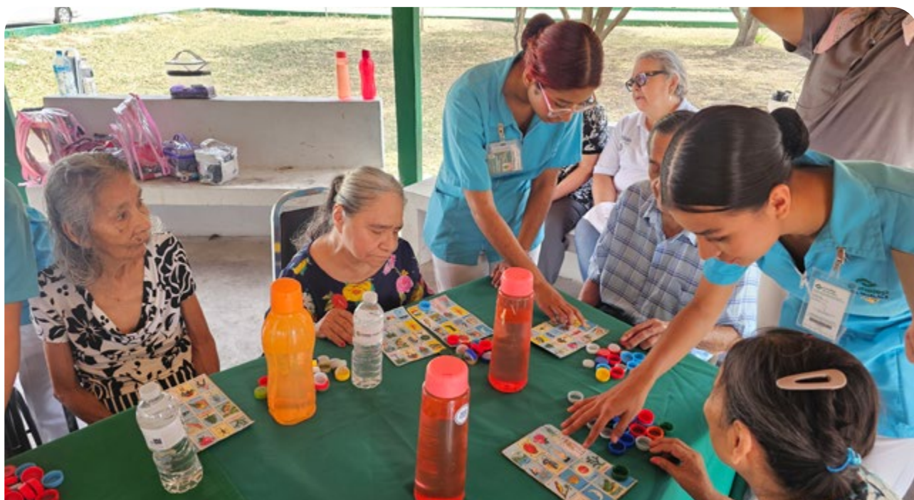
Atención a adultos mayores.

su desarrollo personal y disfrutaron de la actividad turística desde una visión incluyente, a través de diversos talleres, actividades culturales y experiencias recreativas.