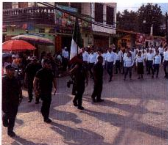
HONORES A LA BANDERA