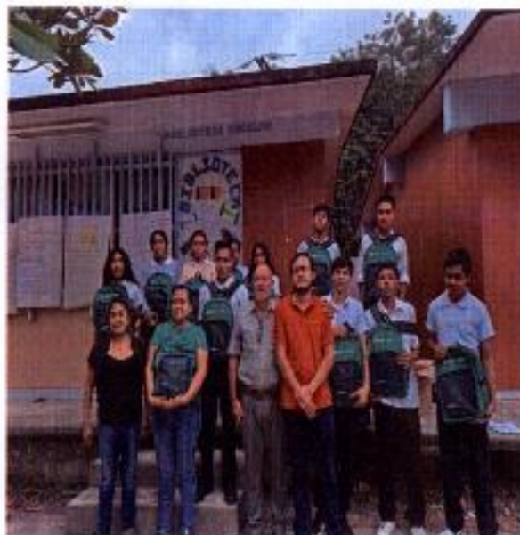
ENTREGA DE ÚTILES ESCOLARES