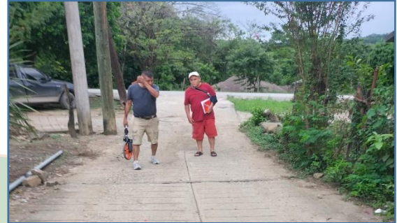
C2A2: Levantamiento topográfico para la creación de proyecto de obra de infraestructura.