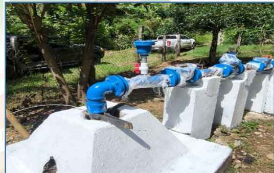
C4A1: Supervisión a las obras de infraestructura realizadas en comunidades y cabecera municipal de Tancanhuitz. S.L.P.