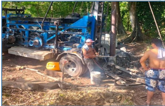
C2A1: Realización de proyectos de infraestructura en beneficio de las localidades del Municipio de Tancanhuitz.