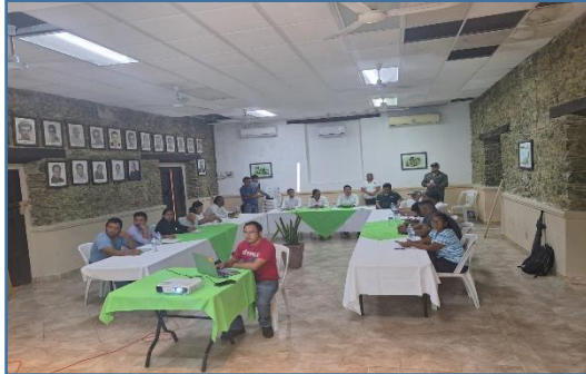
C1A1: Realización de reuniones de consejo para la priorización y supervisión de apoyos sociales y obras de infraestructura.