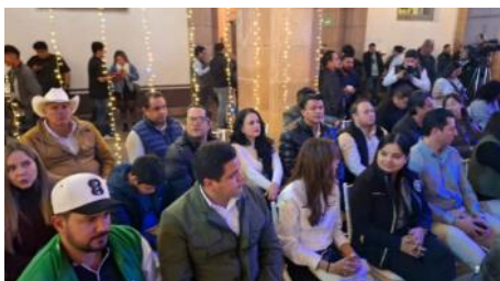
Inauguración del Nacimiento en Palacio de Gobierno.

El Titular de CEFIM, acompañó al Gobernador del Estado en 2 eventos: