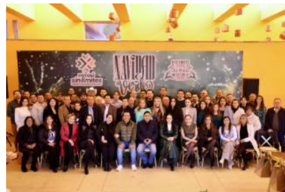
Convivio Navideño con los Integrantes del Gabinete Estatal.