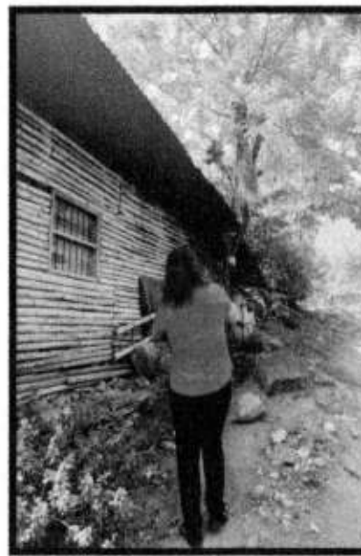
VD. EJIDO LA PURISIMA.