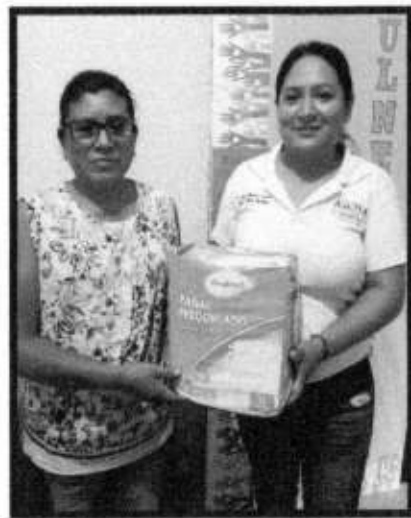
APOYO DE PAÑALES.