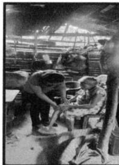
VD. LOC. TENEXCALCO.