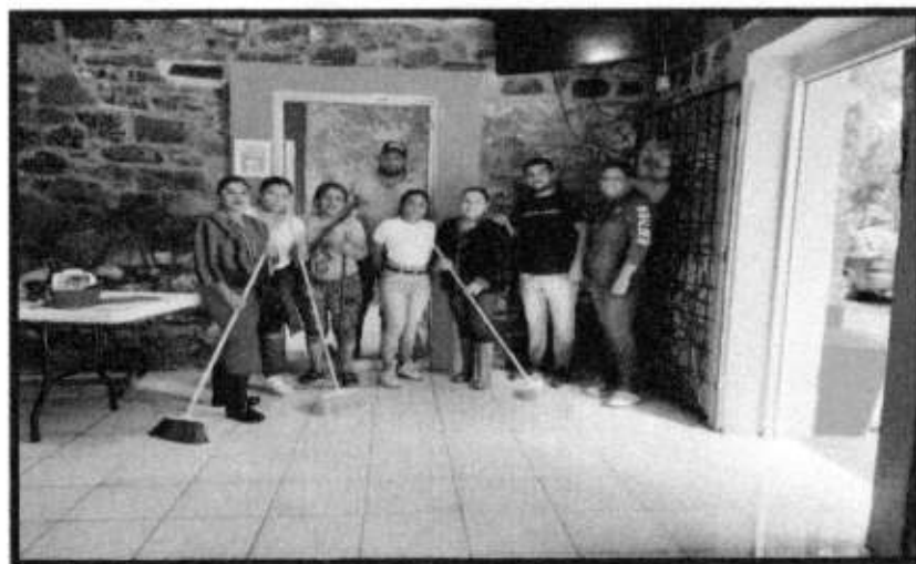
APOYO EN DESASTRE NATURAL.