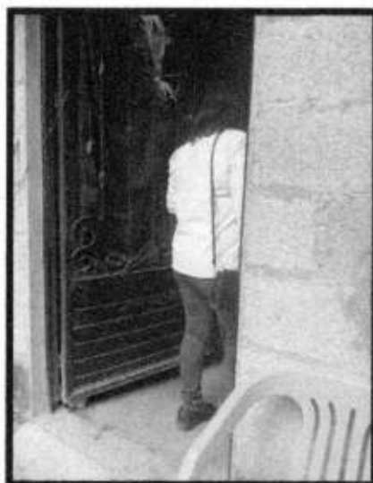
VD. AVE. LOS DEPORTES.