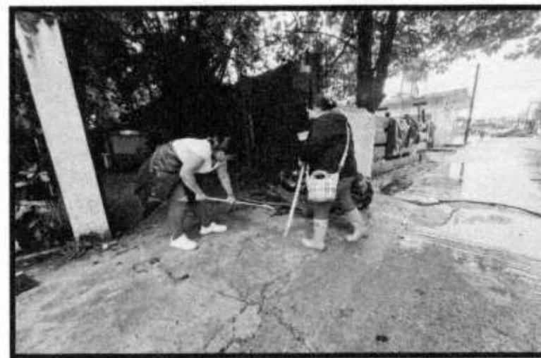
APOYO EN DESASTRE NATURAL.