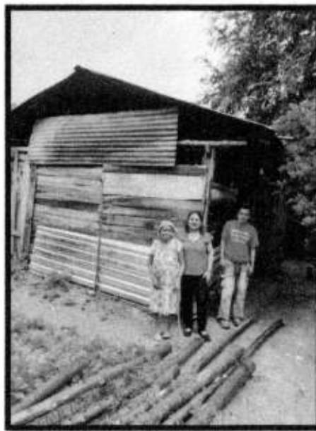
VD. LOC. TENEXCALCO.