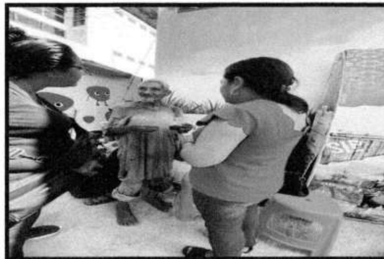
REUBICACION A PERSONAS EN SITUACION DE CALLE.