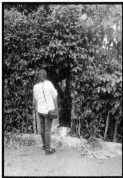
VD. AVE. LOS DEPORTES

DONDE SE ENCUENTRA UBICADO: EN LA REPISA 1-A