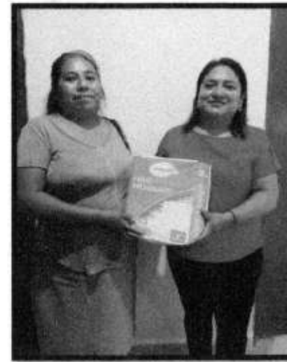
APOYO DE PAÑALES.