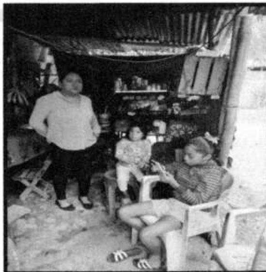
VD. BARR. PROGRESO.