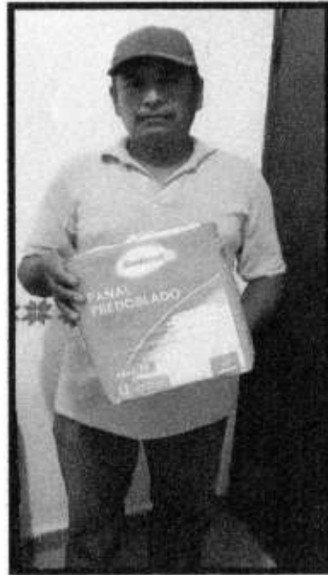
APOYO DE PAÑALES.