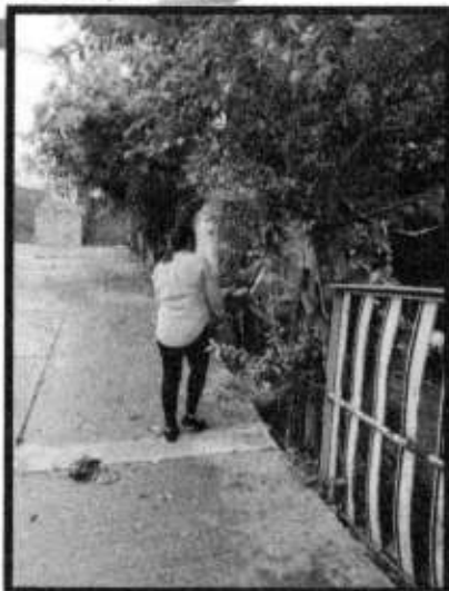
VD. BARR. PROGRESO.