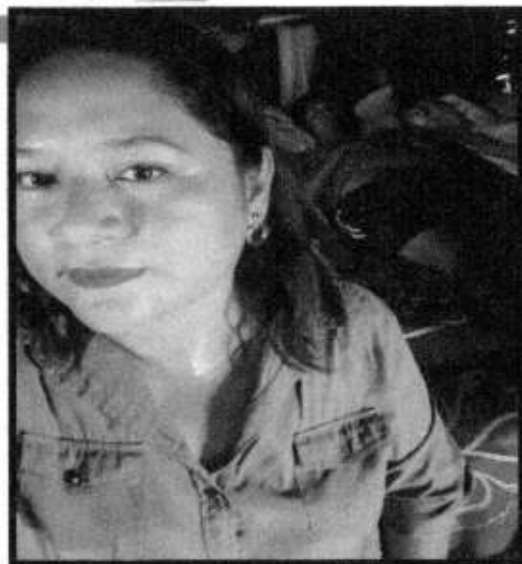
VD. LOC. COMOCA.