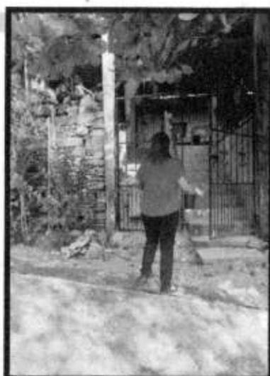
VD. EJIDO LA PURISIMA.