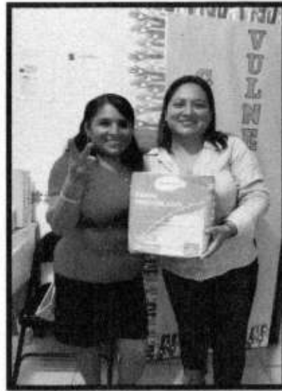
APOYO DE PAÑALES.