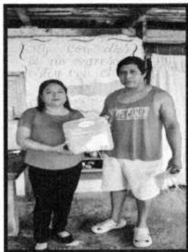
APOYO DE PAÑALES.