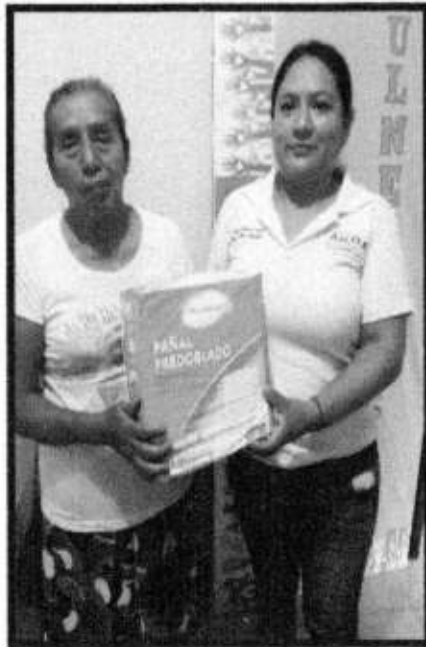
APOYO DE PAÑALES.

DONDE SE ENCUENTRA UBICADO: EN LA REPISA 1-A