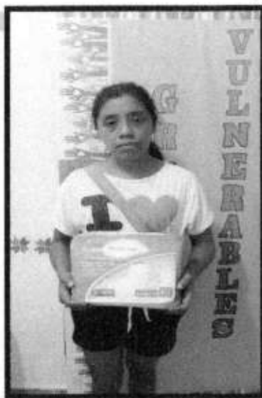
APOYO DE PAÑALES.