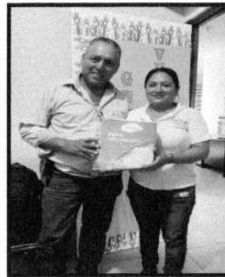
APOYO DE PAÑALES.