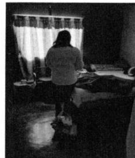
VD. EJIDO COAMILA.