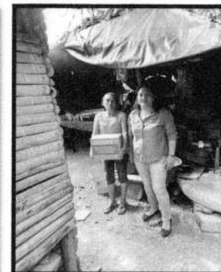
VD. LOC. COMOCA.