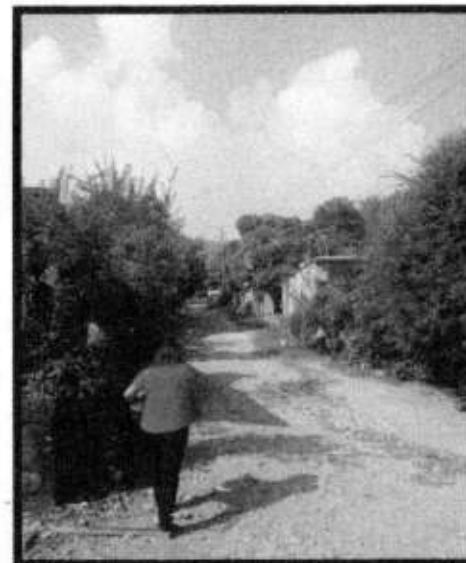
VD. EJIDO LA PURISIMA.