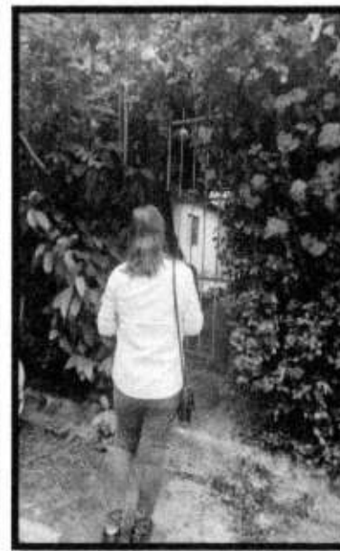
VD. AVE. LOS DEPORTES