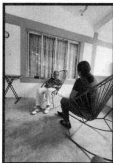
VD. LOC. EL LAUREL.