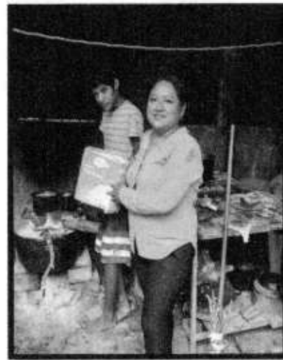
APOYO DE PAÑALES.