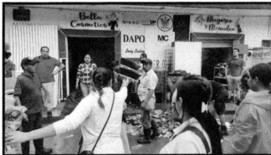
APOYO EN DESASTRE NATURAL.