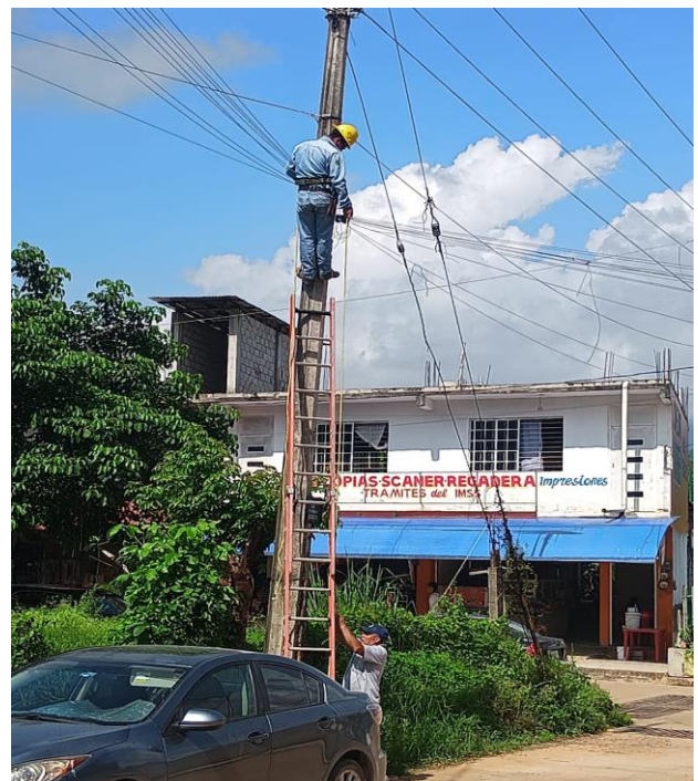
ARREGLO DE LUMINARIA COL. DOCTORES.