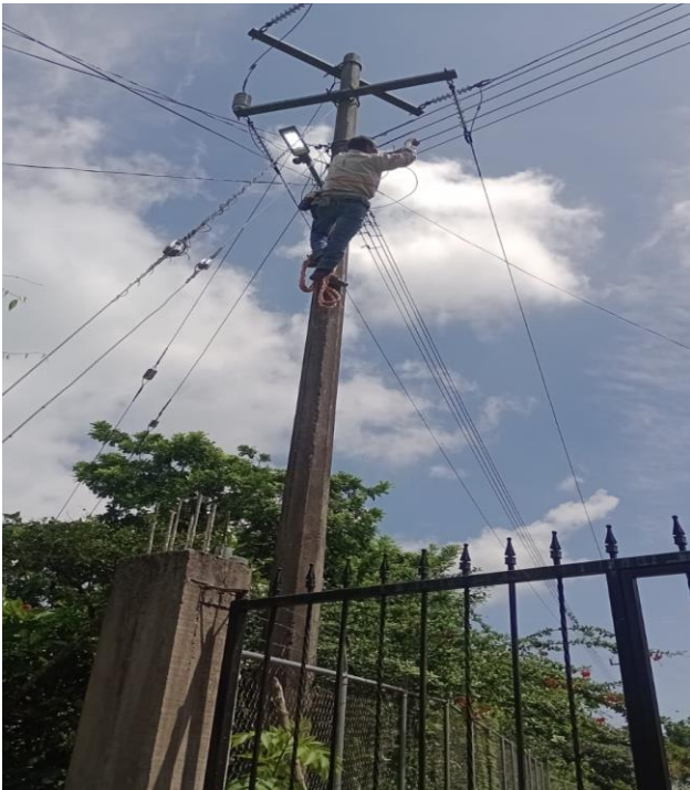
MANTENIMIENTO DEL ALUMBRADO EL ENCINAL SAN FRANCISCO