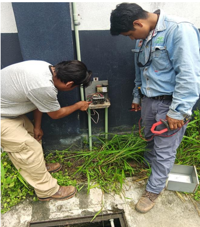
REVISION DEL SISTEMA DE BOMBEO EDIFICIO DE SEGURIDAD PÚBLICA